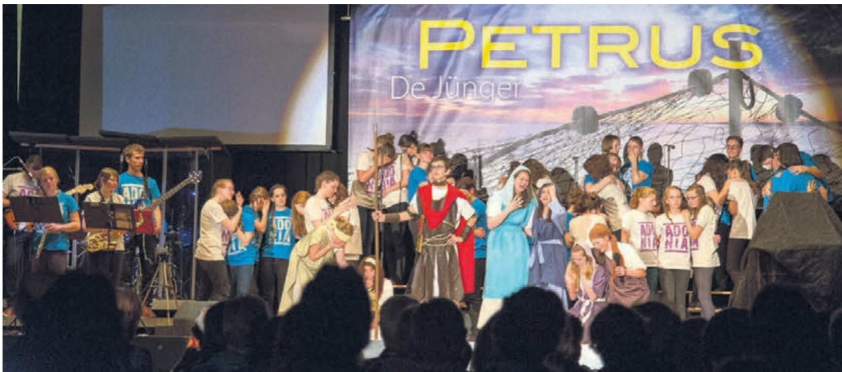
Grosse Gefühle in bibeltreuer Umsetzung: Reaktionen der Jünger bei Jesu Kreuzigung