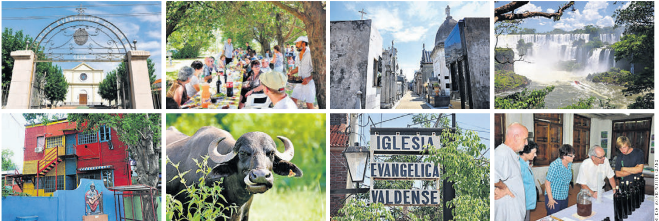
Das Gebiet am Rio de la Plata, zwischen Uruguay und Argentinien, ist die Heimat der Waldenser Kolonien