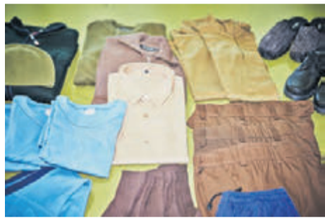
Braun, Blau und Oliv dominieren

IM EINHEITSLÖCK. Jeder Häftling erhält beim Eintritt in der JVA Pöschwies einheitliche Anstaltskleidung, zu der als wichtigste Teile braune Hosen, blaue T-