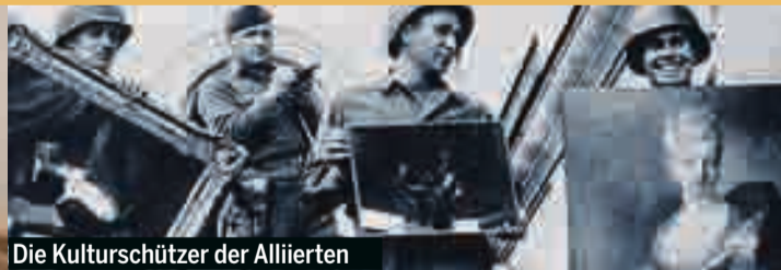
Die Kulturschützer der Alliierten