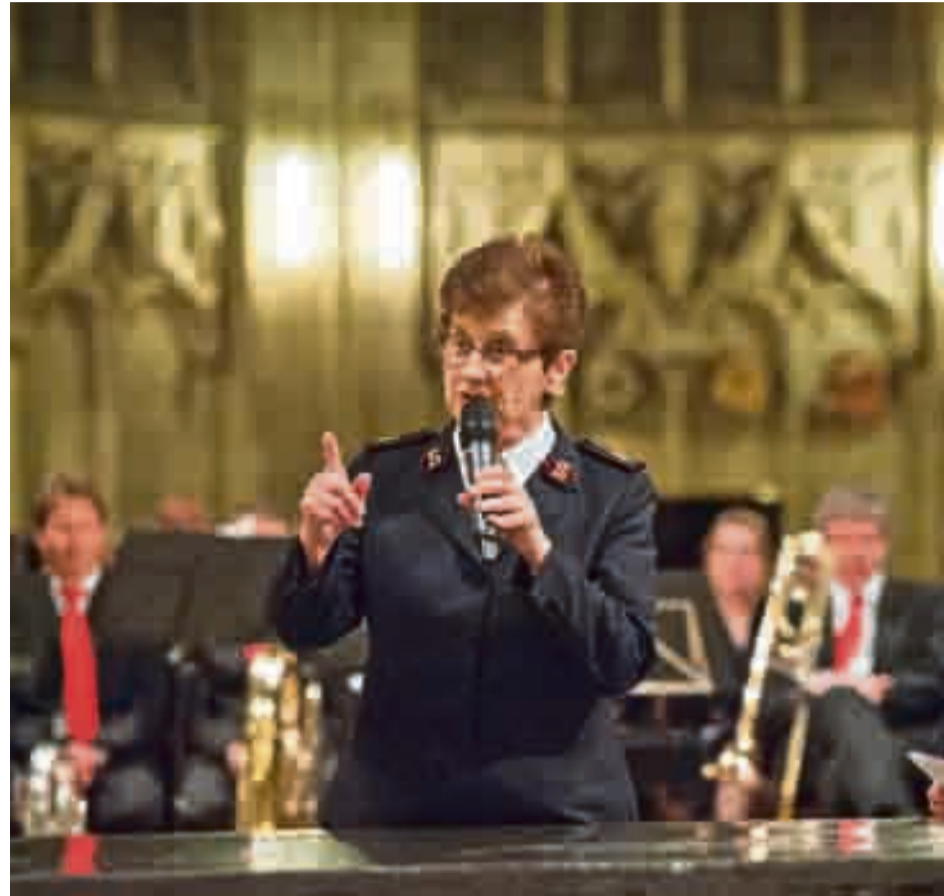
Linda Bond: Eindringlich während der Predigt im Berner Münster...

ÖKUMENE/ Linda Bond ist das Oberhaupt der weltweiten Heilsarmee und in dieser Funktion oft unterwegs. Kürzlich war sie in der Schweiz.