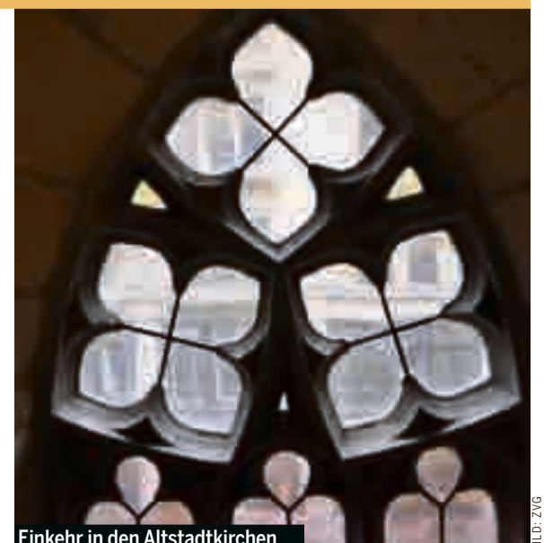
Einkehr in den Altstadtkirchen