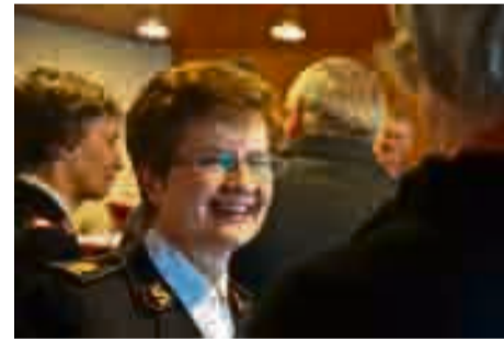
... und humorvoll im Gespräch