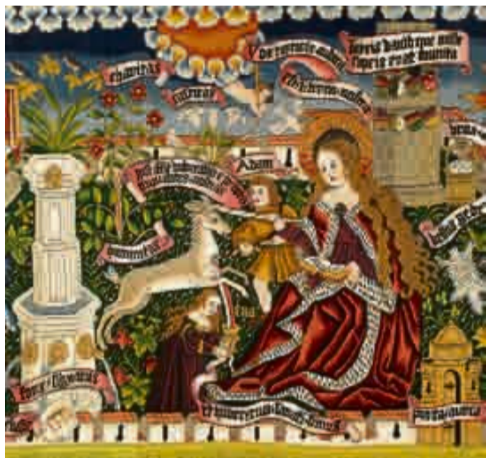
Die Jungfrau Maria fängt und zähmt das Einhorn

AUSSTELLUNG/ Das Landesmuseum zeigt in der Schau «Animali» Tiere, Fabelwesen und Ungeheuer von der Antike bis zur Neuzeit.