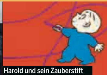
Harold und sein Zauberstift