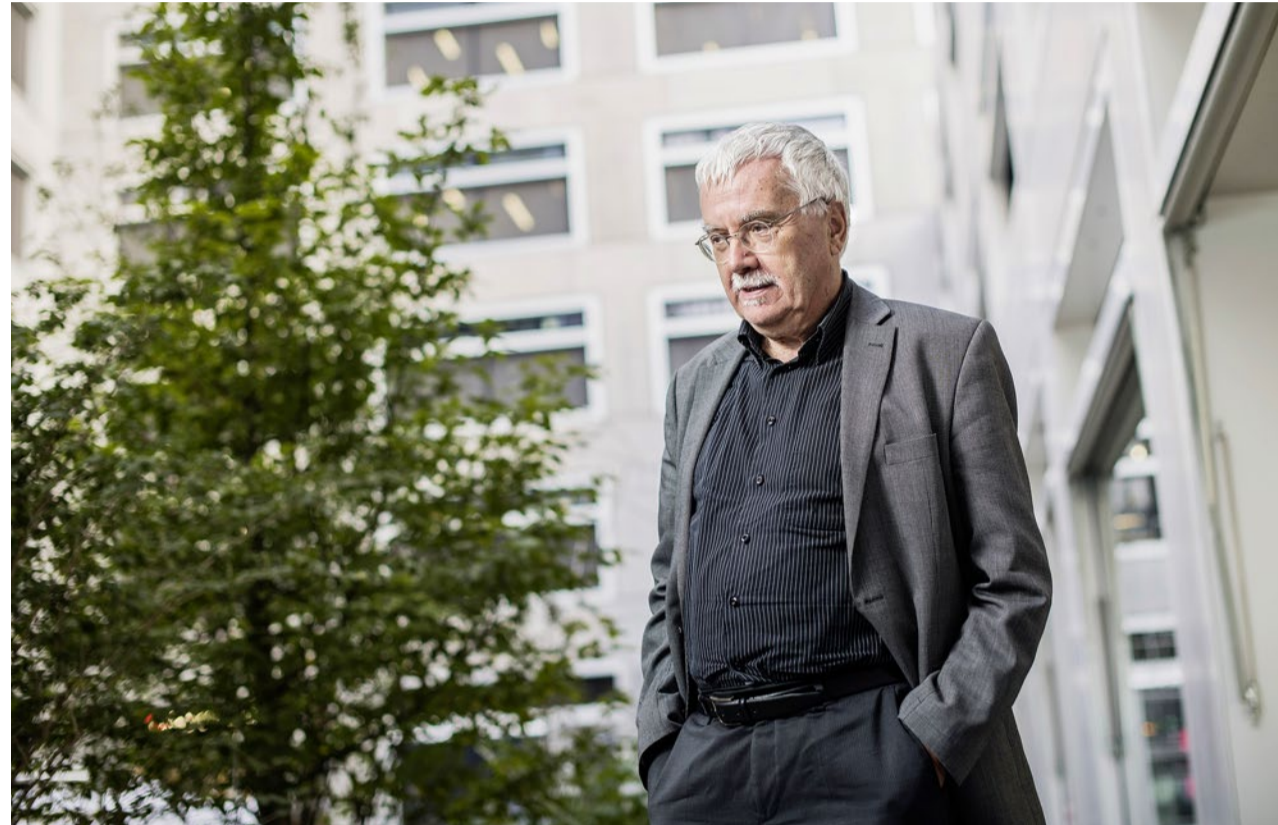
«Wir experimentieren weit weg von ökonomischen Lehrbuchtheorien. Mit ungewissem Ausgang.»