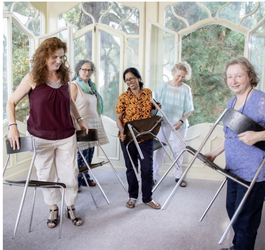
Frauen verschiedener Religionen finden nebeneinander ihren Platz.

Interreligiöses Frauengebet, 22. November, 18 Uhr, St. Anna Kapelle, St. Annagasse 11, Zürich. Eintritt frei. www.zvisite.ch