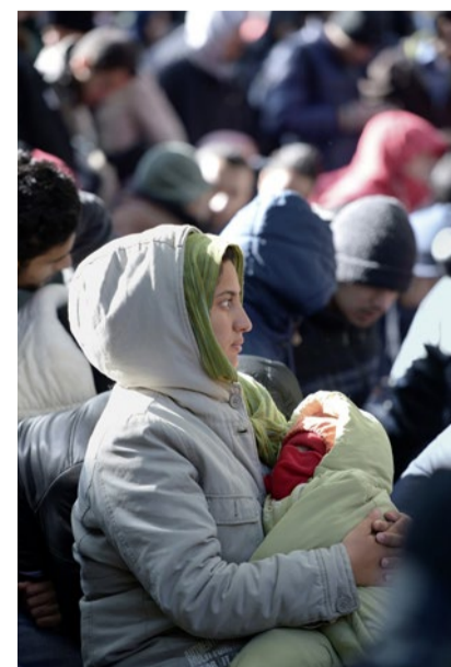
Flüchtlinge warten auf ihre Registrierung in Berlin.

nahme oder einen schnellen und flexiblen Familiennachzug. Dieser solle sich nicht nur auf die Kernfamilie beschränken, sondern «die tatsächlich gelebten Familienbande»