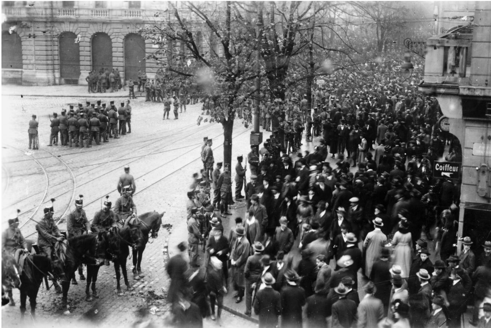
Bewaffnete Soldaten stehen im November 1918 auf dem Paradeplatz wütenden Arbeitern gegenüber.