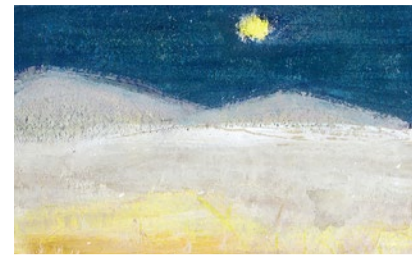
Advent unter dem Stern.