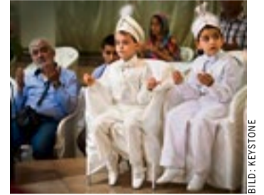
Religionsfreiheit vs. Unversehrtheit

trächtigen? Nein! Denn mit diesem Argument könnten noch viel weiter gehende Grausamkeiten legitimiert werden. Die Religionsfreiheit muss dort enden, wo jene der anderen Person beginnt – auch beim eigenen Kind. Das Argument, es handle sich um einen kleinen Eingriff, mag operationstechnisch zutreffen. Was der Betroffene an körperlichen und seelischen Empfindungen erlebt,