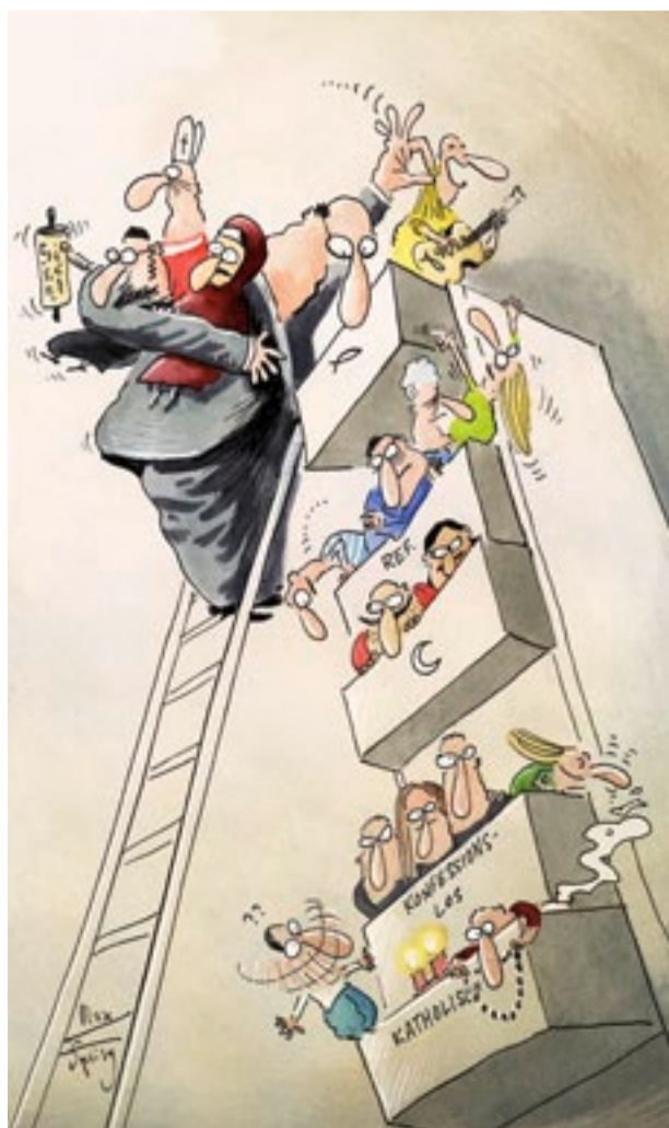
Auch in der Statistik: Schubladisieren will gelernt sein