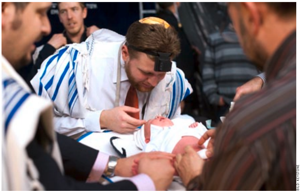
Knabenbeschneidung in einer Synagoge in Budapest

stellungen verteidigt und sich mitunter auch Kritik erlaubt. Ich bin optimistisch, dass Religionsgemeinschaften sich modernen Wertvorstellungen anpassen können – das beste Beispiel ist die katholische Kirche. Vor 150 Jahren war sie gegen die Zivilehe, Mischehe, die öffentliche Schule und für die Todesstrafe. Dass sie von diesen Positionen abrückte, war die Folge davon, dass die Reformierten und Libera-