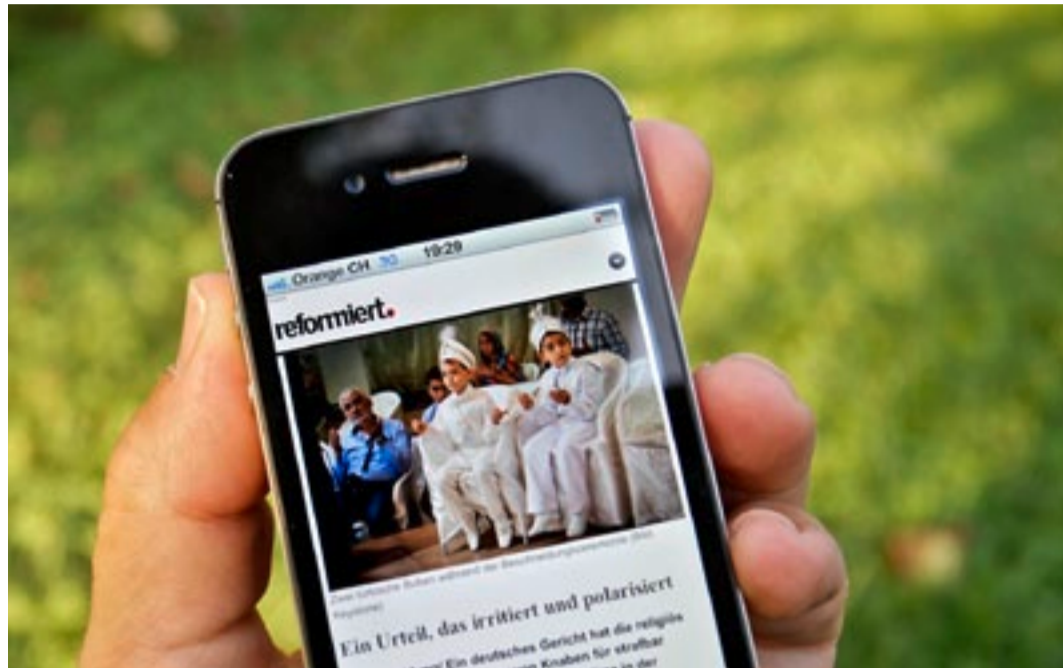
Praktisch: «reformiert.» kann man jetzt auch auf dem Smartphone lesen

INTERNET/ www.reformiert.info kann ab sofort auch auf Smartphones und Tablets angeschaut werden.