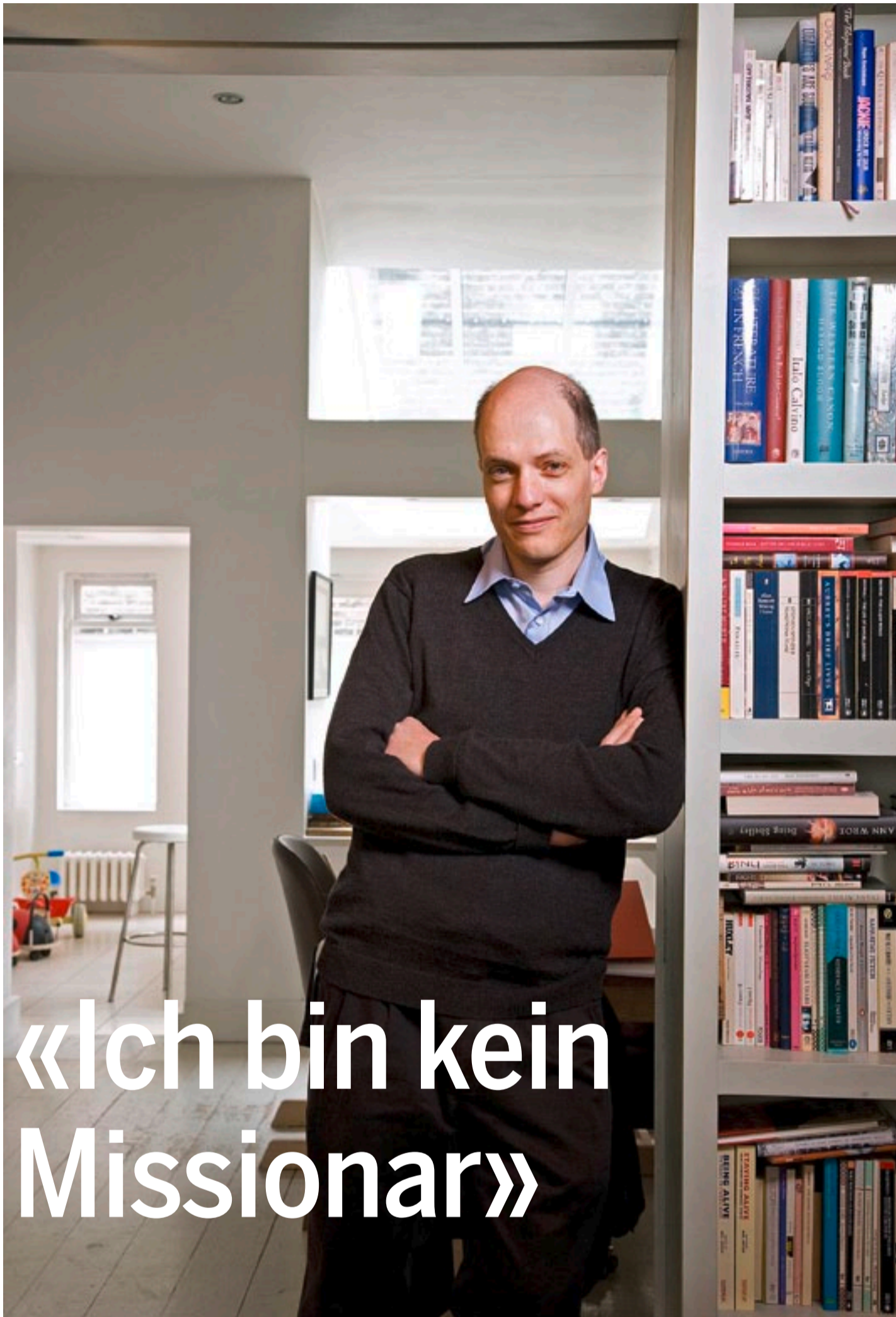
Alain de Botton: «Das Christentum ist eine liebende, tolerante, ja zärtliche Religion»