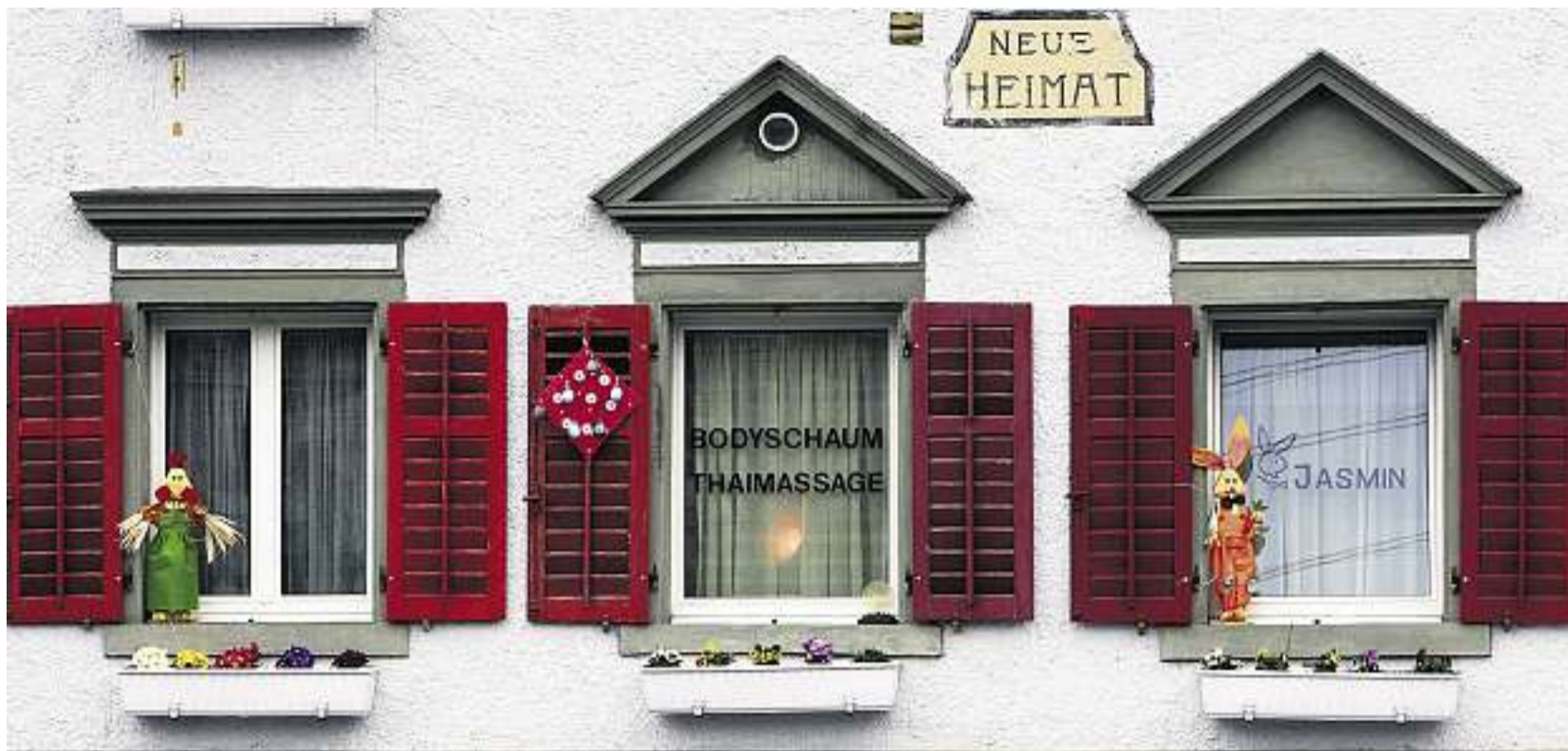
Neue Heimat im Bordell: Unauffälliges Sexetablisement mit Häschendeko im Kanton Luzern