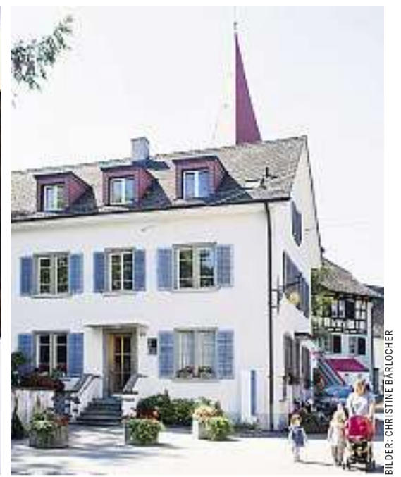
Gartenwirtschaft, Erwachsenenlounge, Bistro, Kinderhaus: Nach dem Umbau des Hauses Sonnegg sollen die Hönggerinnen und Höngger noch häufiger bei der Kirche einkehren können