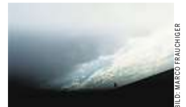
Was enthüllt die Apokalypse?

Das Wort Apokalypse heisst nicht etwa Weltuntergang, sondern «Enthüllung» oder «Offenbarung». Die Apokalypse bereitet vor. Sie enthüllt den Plan Gottes mit seiner Erde. Tatsächlich sind viele der in der biblischen Prophezie genannten Zeichen und Ereignisse heute in Erfüllung gegangen. Jedoch ein Christ, der die nächste Katastrophe eher erwartet als die Wiederkehr des Herrn, hat den