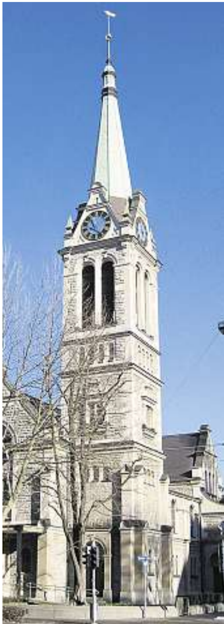
Steht im Zentrum des Zürcher Industriequartiers: Die Johanneskirche