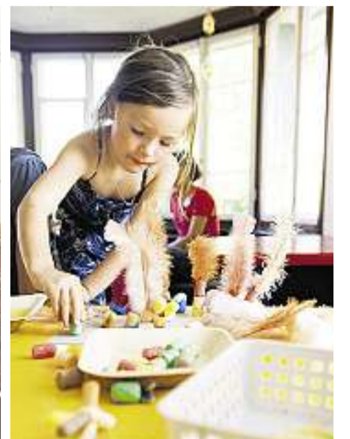
Der Familientag im Sonnegg zeigt, was hier zukünftig stattfinden könnte. «Ob uns das Kindergeschrei stört? Überhaupt nicht. Wir sind alle Grossmütter!», meinen die älteren Damen