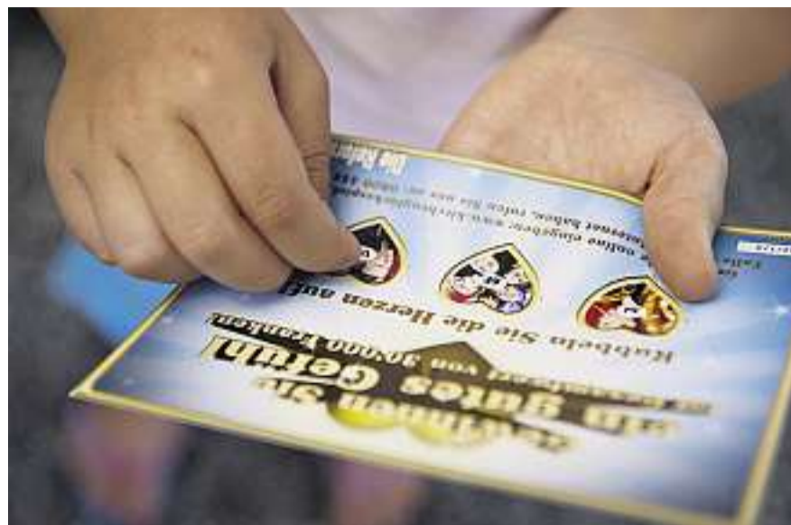
Rubbeln für soziale Projekte: Das Kirchenglücksspiel verzeichnete einen grossen Rücklauf

PROJEKTE. Besonders das modern aufgelegte Jugendprojekt «JugendEnergy» der Wiediker Gemeinde schien die Spender zu überzeugen. Es bekam 350 Franken. Beliebt bei den Spendern war auch die Kindermusicalwoche der reformierten Kirchengemeinde Stadel im Zürcher Unterland, die zukünftig in regelmässigen Abständen