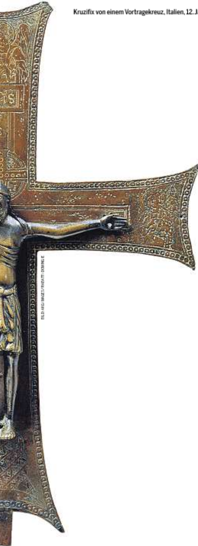
Kruzifix von einem Vortragekreuz, Italien, 12. Jahrhundert