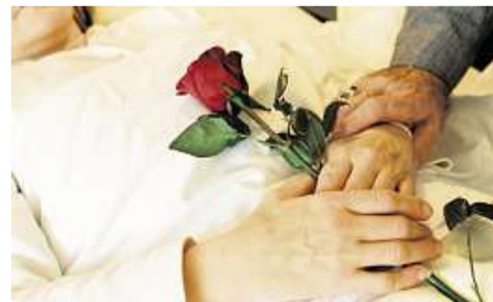
Der Wunsch nach einem friedlichen Tod ist gross

KEIN VERBOT. Aber dennoch plädieren beide kirchliche Institutionen für die Variante 1 und lehnen ein kategorisches Verbot der Suizidbeihilfe ab. Sie anerkennen damit, dass es für Menschen Lebenssituationen geben kann, in denen sie sich für den Suizid entscheiden. «Aufgrund des christlichen Menschenbildes hält der Kirchenrat die Beihilfe zum Suizid im Grundsatz für äusserst problematisch. Gleichzeitig weiss er, dass es schwer leidende Menschen gibt, die sich für den Suizid entscheiden. Ein Suizid und die Beihilfe dazu, die aus innerer Not geschehen, werden vom Kirchenrat nicht verurteilt. Daher steht er hinter der derzeit bestehenden Gesetzgebung, die den Suizid und die Beihilfe dazu, wenn Letztere nicht aus eigennützigen Motiven geschieht, straffrei lässt», schreibt der Zürcher Kirchenrat. Der SEK begründet seine Haltung ähnlich: «Der Vorrang des Lebensschutzes muss gewahrt sein. Zugleich gehören Lebensschutz