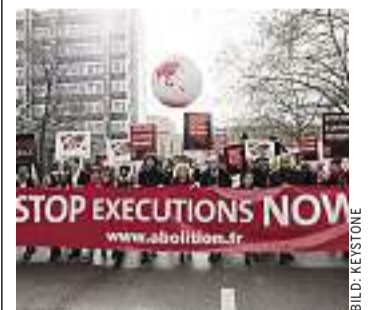
«Stopp den Hinrichtungen!» Der Weltkongress gegen die Todesstrafe machte sein Anliegen auch in den Strassen von Genf publik

Als christliche Organisation ist für uns der tiefste Bezugspunkt die Kreuzigung von Jesus. Wir fragen: «Wie können Christinnen und Christen bloss für die Todesstrafe sein, wenn sie doch im Namen Jesu auftreten, der selber gefoltert und hingerichtet wurde?» Die Botschaft vom Tod am Kreuz heisst ja, dass Gott keine Menschenopfer mehr will.