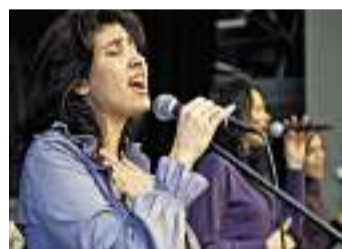
Treffpunkt Kirche Wipkingen

Natürlich freute ich mich, als ich die mir wohlbekannteren Farbfenster des Saales unseres Kirchgemeindehauses entdeckte. Nur dem allerersten Satz im Beitrag muss ich als Präsidentin der Kirchgemeinde Wipkingen widersprechen. Von einem «ehemaligen (Kirch)gemeindehaus» kann keine Rede sein! Nach wie vor nutzen wir als Kirchgemeinde unser Haus intensiv und vielfältig. Die Büros unserer diakonischen Mitarbeitenden und des Sekretariats befinden sich im Haus, es hat Sitzungszimmer, Versammlungsräume, einen Jugendraum, Woh-