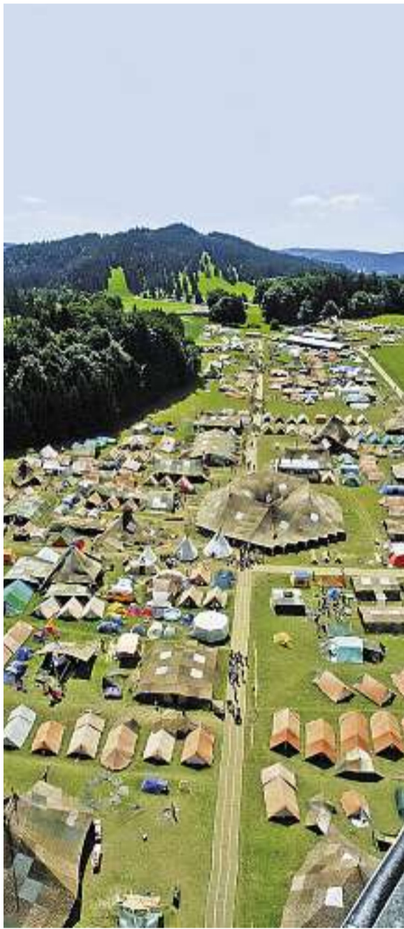
Gibt es bald keine solchen grossen Cevi-Lager mehr?

MITGLIEDERSCHWUND/ Mit einer verspielten Imagekampagne und einem kantonsweiten Cevi-Tag geht die christliche Jugendorganisation in die Offensive.