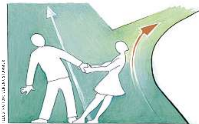
ILLUSTRATION: VERENA STUMMER

TRENNUNG?/ Eine häufige Konstellation: Sie möchte eine Familie und Kinder, er möchte vor allem Freiheit und seine Ruhe. Hat eine solche Beziehung Zukunft? Eine Leserin fragt um Rat.