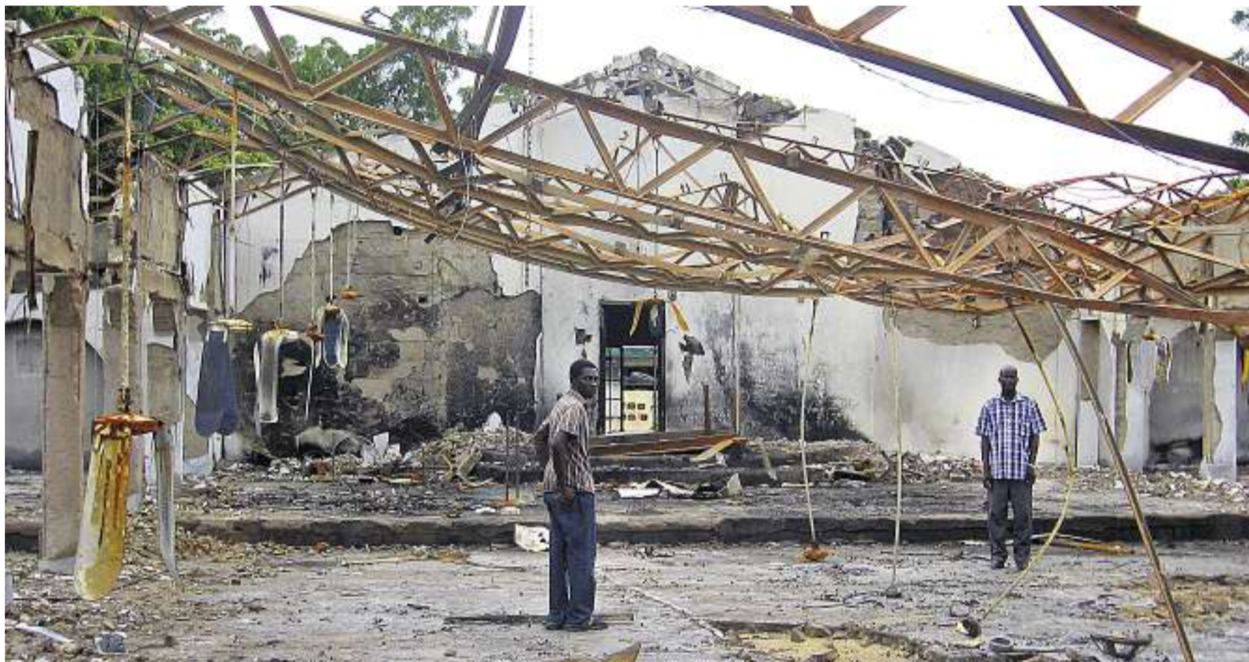
Tatort Maiduguri (Nigeria): Brandanschlag auf ein Gotteshaus der «Kirche der Geschwister». Brandstifterin: eine islamistische Sekte