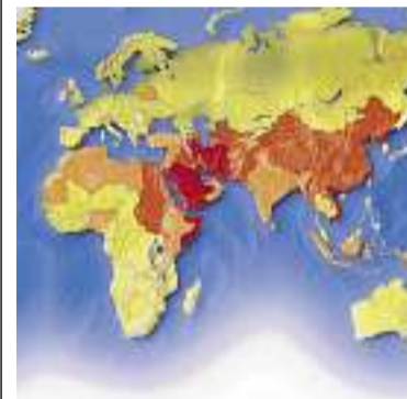
Hellorange bis tiefrot: Stufen weltweiter Christendiskriminierung