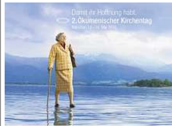
Einladung zum Ökumenischen Kirchentag

INFORMATIONEN zum Zweiten Ökumenischen Kirchentag: www.oekt.de Fragen an Boldern: Evangelisches Tagungszentrum Boldern, Postfach, 8708 Männedorf, Tel. 044 921 71 71