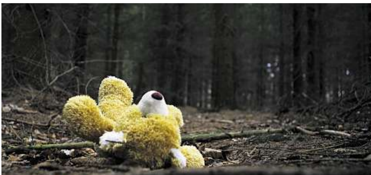
Die Frage nach der Verjährbarkeit von Straftaten – insbesondere jenen an Kindern – ist auch theologisch brisant

Seither wird das Thema nicht mehr angeschnitten. So schlecht scheint der gefriergetrocknete Kaffee auch wieder nicht zu sein.