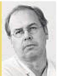
THIERRY CARREL, 48, ist der bekannteste Herzchirurg der Schweiz. Er operiert am Berner Inselspital.