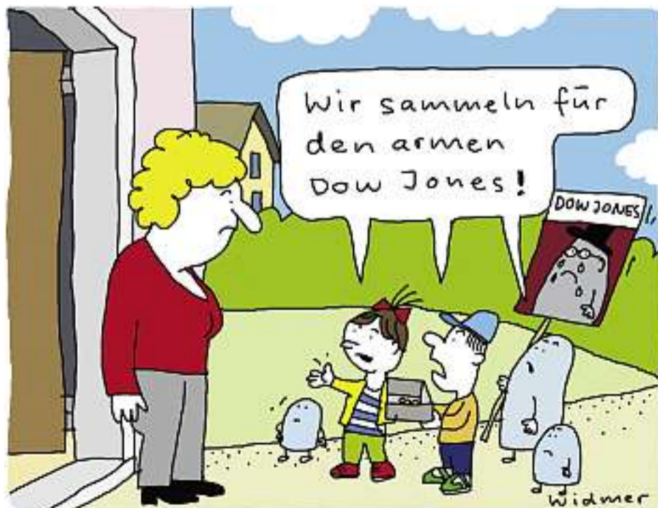
Und wie viel Geld bleibt für die Entwicklungshilfe?

Ein Grundsatz, der leider auch für die privaten Spender gilt – wenn auch (noch) nicht in der Schweiz: In Deutschland beklagen Hilfswerke einen markanten Einbruch der Spenden. DELF BUCHER