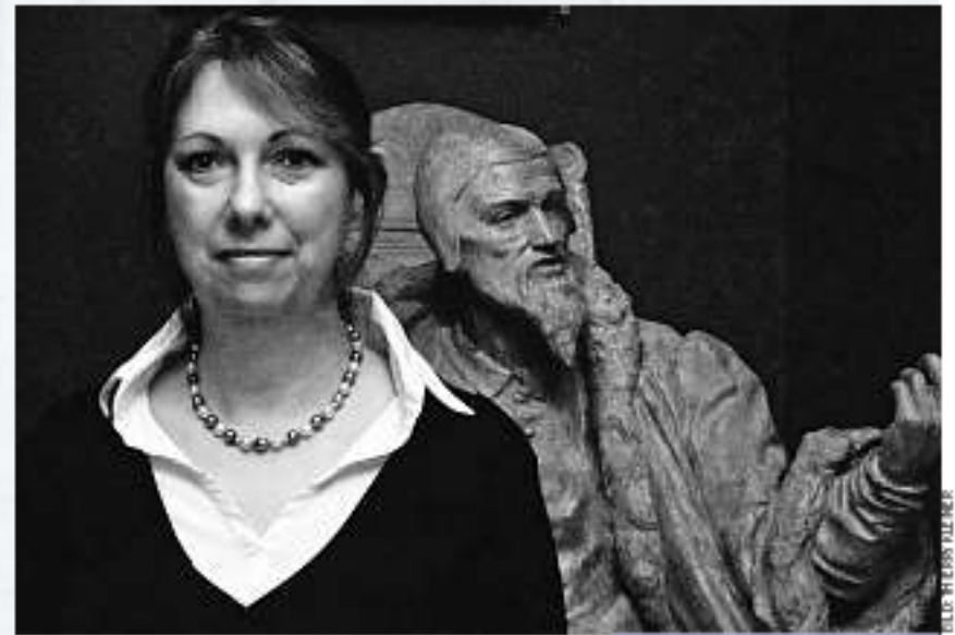
«Ein widersprüchlicher Reformator»: Isabella Graesslé über Johannes Calvin

3D-CALVIN. Die Widersprüchlichkeit des Reformators soll auch in der Sonderausstellung zum Calvin-Jubiläum zum Ausdruck kommen, die an Ostern 2009 startet. Das Publikum wird dabei unter anderem den Tagesablauf Calvins verfolgen können: vom Aufwachen um vier Uhr morgens über einen Gottesdienst bis hin zu Auseinandersetzungen mit Gegnern. Dabei wird sich Calvin als dreidimensionale Figur im Raum bewegen – dank der ausgeklügelten Technik eines Informatiklabors. SABINE SCHÜPBACH