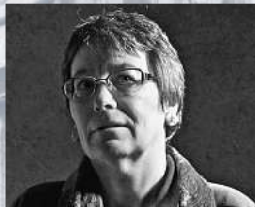
«Johannes Calvin hat die Theologie mit seinen sozialen Ideen für die Neuzeit geöffnet»

VERANTWORTUNG. «Ausserdem: Wer Geld hat, trägt eine soziale Verantwortung. Dieses von Calvin geprägte Bewusstsein spürt man noch heute in einigen Genfer Familien. Da gibt es Bankiers, die sozialen Projekten namhafte Beiträge spenden – oder der Kirche. Dies ist auch nötig, denn da im Kanton Genf