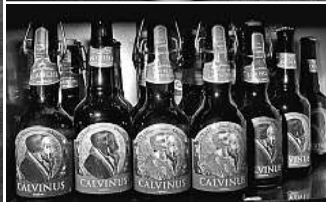
BILDER: THIERRY ALENIER