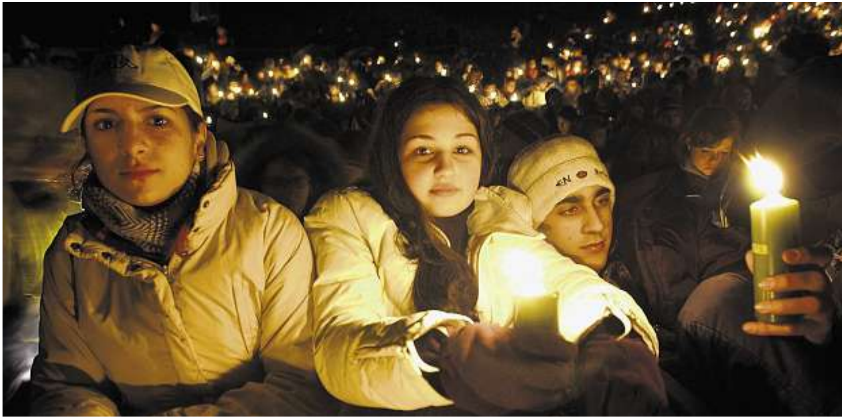
Würdig fürs Ökumene-Label? Das Ranfttreffen, an dem jedes Jahr über tausend Jugendliche teilnehmen – heuer am 20./21. Dezember (www.ranfttreffen.ch)