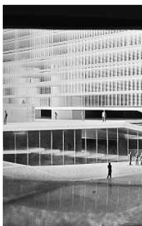
Zürich steigt in Bern ein: «Haus der Religionen» am Europaplatz

ÜBERHAUPT. Unterdessen weiss man, dass Stolpersteine in der Sprache ganz nützlich sind: Wo jemand zögert, stottert, sich verspricht, wird der Sprachfluss unterbrochen – und genau das weckt das Interesse des Gegenübers, das nun etwas Besonderes erwartet und deshalb besser zuhört. Damit sind alle Schlechtredner definitiv rehabilitiert und ich, ähmm, nun ja, ich darf jetzt, hmmm, getrost einen Punkt setzen.