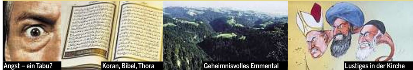
Angst – ein Tabu?