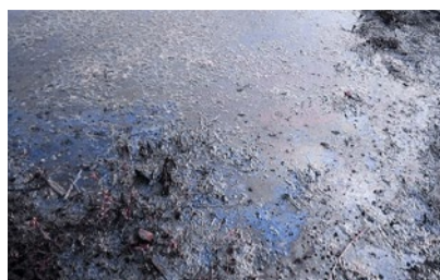
Umweltschäden in Tschad