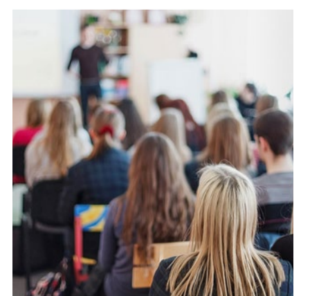
Verteilungskampf: Die Studententafel ist kein Wunschzettel.