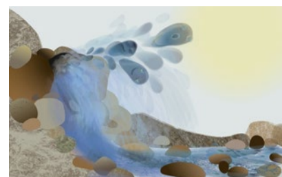
Grosse Reise Illustration: Christine Peters