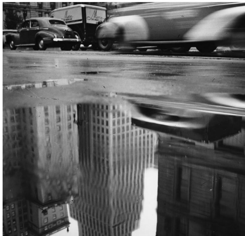
Robert Frank, New York City, 1948.

Kleine Leute, befrackte Börsianer, Schwarze und Weisse getrennt – was Robert Frank 1955/56 auf seinem fotografischen Trip durch die USA vor die Linse kam, zeigt überdeutlich: Die sozialen Konflikte von damals sorgen bis heute für Schlagzeilen. Schonungslos porträtierte der Zürcher Fotograf die USA. Verstärkt wird die düstere Atmosphäre der Fotos durch Franks Stil wie bewusste Bewegungsunschärfe und grobkörnige Aufnahmen. bu