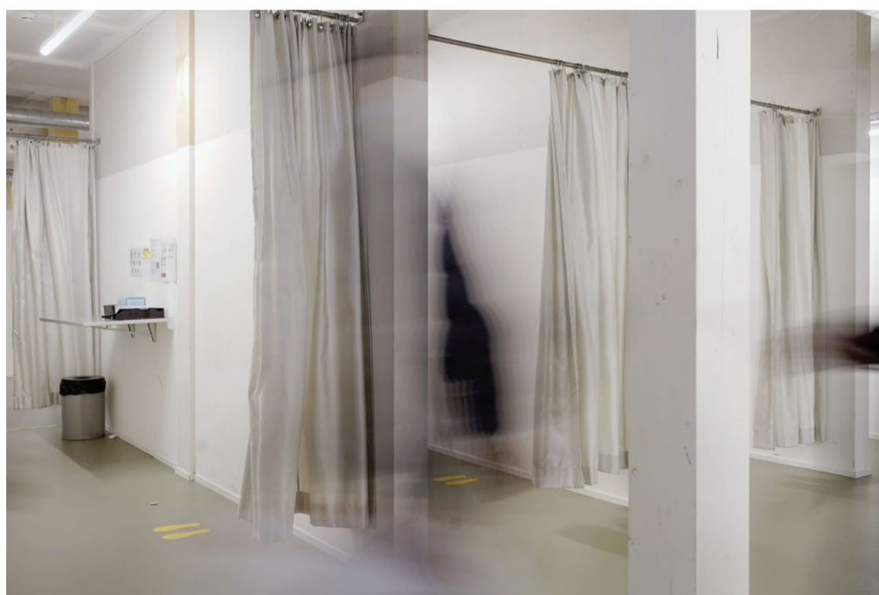
In diesen Kabinen werden Asylbewerbende nach verbotenen Gegenständen abgesucht.

Unangetastet liess man hingegen den Raum der Stille, in den sich die Asylsuchenden und auch die Seelsorgenden zum Gebet zurückziehen können. «Wir hüten das Heiligtum», sagt Arnold Steiner lächelnd. Er betet dort regelmässig für sich die Seligpreisungen (Mt 5,1–9) – zur