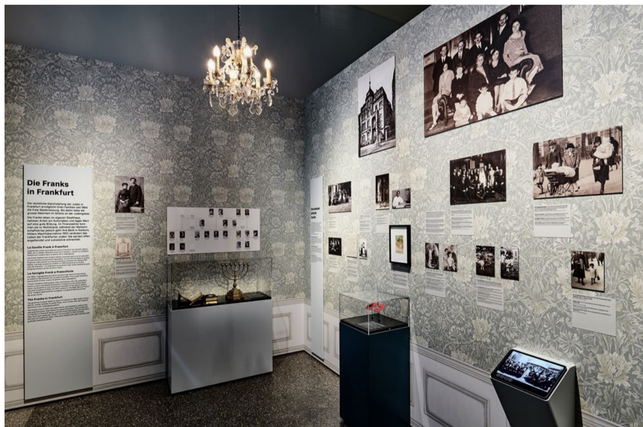
Im Landesmuseum: Das Tagebuch der Anne Frank (oben) und die Familiengeschichte der Franks (unten).