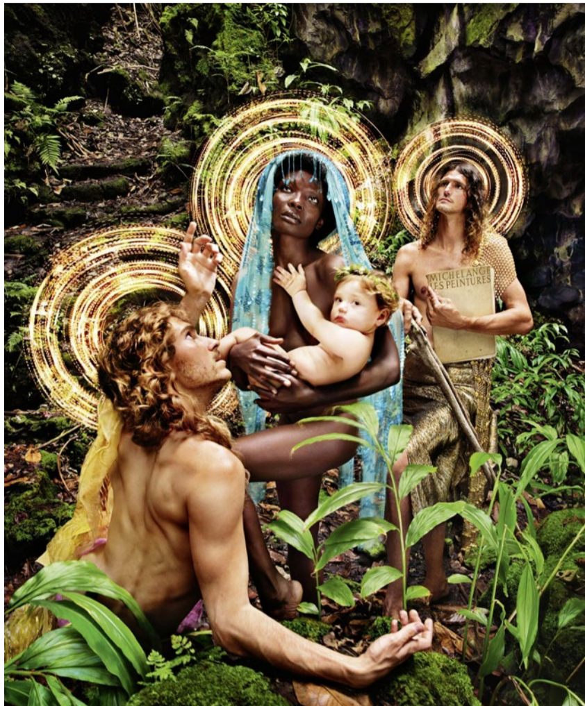
Die Heilige Familie mit dem heiligen Franziskus.

«Ich spürte, dass mich etwas leitet, was über mich hinausgeht.»