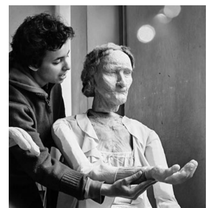
Studentin und Bewohnerin.