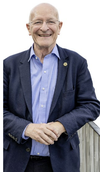
Claude Nicollier (77) nahm in den 1990er-Jahren an insgesamt vier Weltraumfahrten teil.