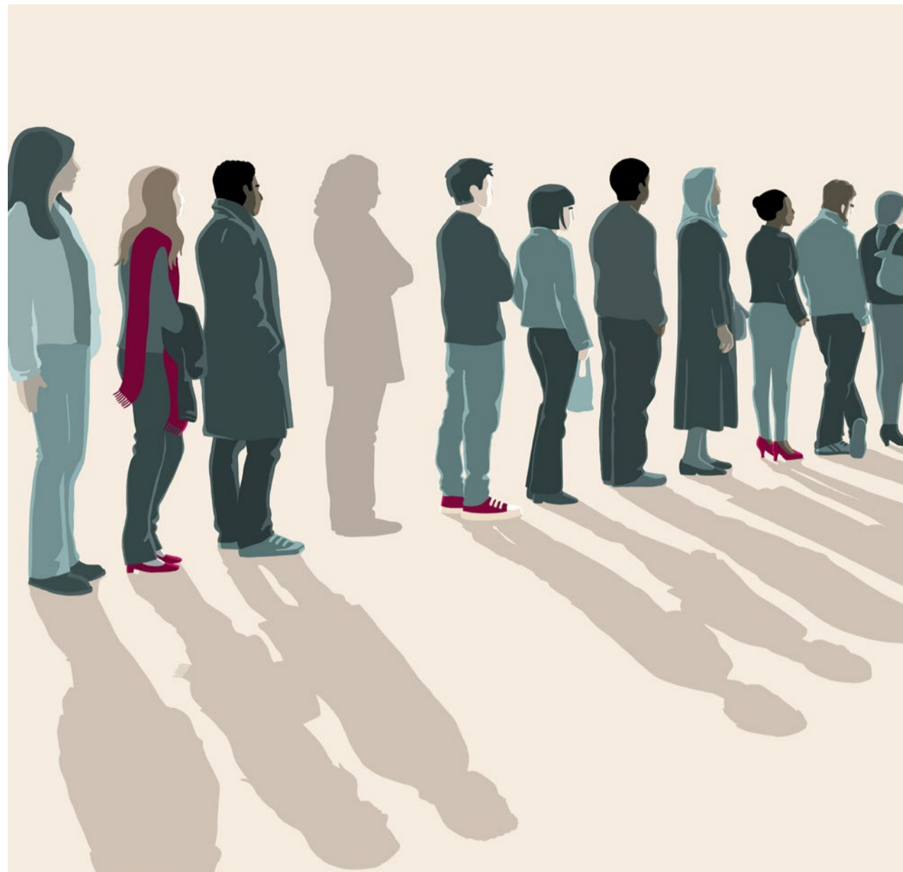
In der Schweiz erhalten nicht alle Opfer von Menschenhandel staatlichen Schutz.