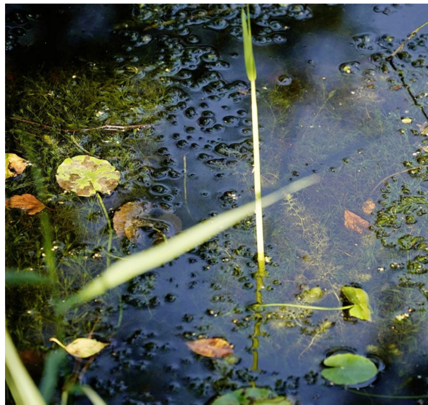
Zeichen wachsen aus geheimnisvoller Tiefe.

Variationen einer Wirklichkeit. Bis 24. Juli, Kloster Kappel, www.klosterkappel.ch