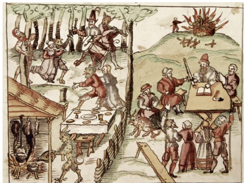
So stellte man sich eine Teufelshochzeit vor.

Illustration: Wickiana ZBZH Ms F 18.146v