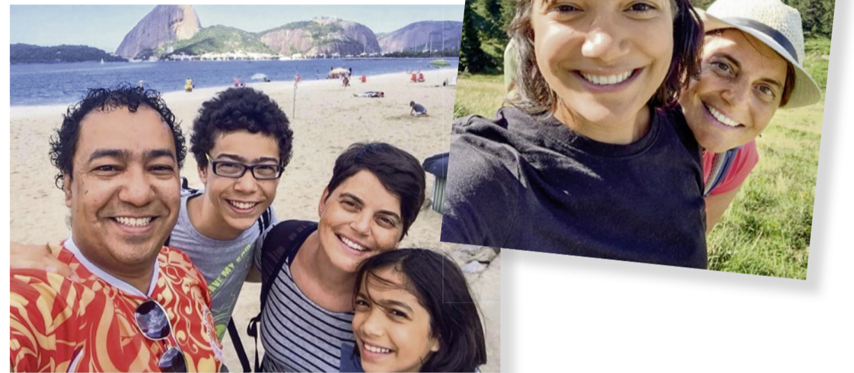
Familie ist möglich, auch auf unkonventionelle Art.