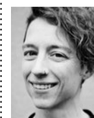
Corinne Dobler Sozialwerk Pfarrer Sieber und Pfarrerin Bremgarten-Mutschellen

Es ist verständlich, wenn es Tage gibt, an denen Sie keine Kraft haben. Seien Sie dann besonders nachsichtig mit sich. Sollte dies jedoch zu einem Dauerzustand werden, nehmen Sie bitte ärztliche Hilfe in Anspruch.