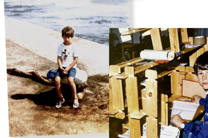
«Wer ist mein Vater?», wird sich der Bub einmal fragen.