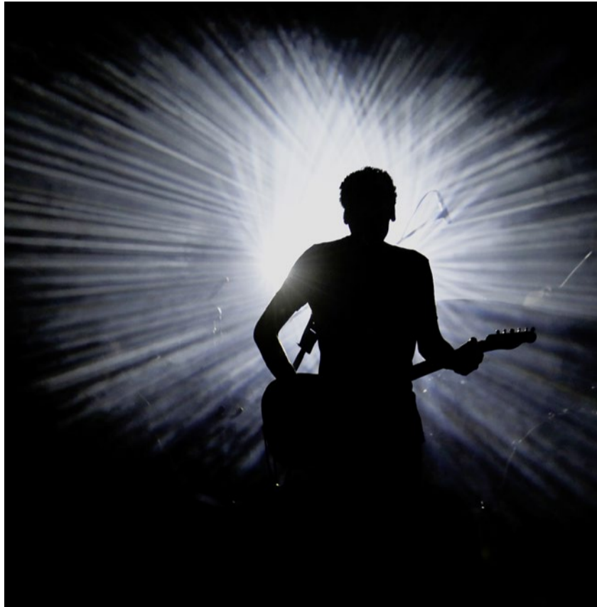
Grenzen überwunden und zu sich selbst gefunden: Dudu Tassa.

Mit ihrem Album, das in einer Zeit der plumpen Verpolitisierung und