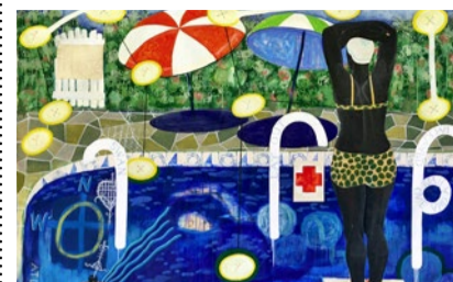
Marshalls «Plunge».