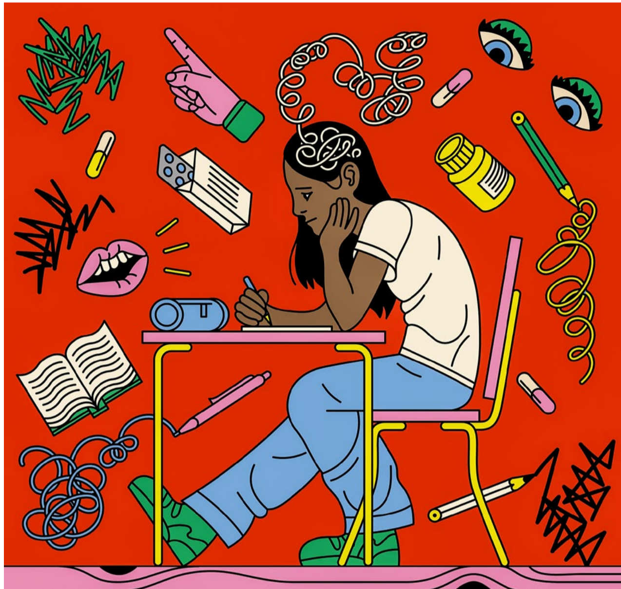
Illustration: Laura Edelbacher

Die Aufmerksamkeitsdefizit-Hyperaktivitätsstörung (ADHS) ist eine Entwicklungsstörung, die in der Kindheit auftritt und bis ins Erwachsenenalter andauert. Die Kernsymptome sind Unaufmerksamkeit, Hyperaktivität und Impulsivität. Was ADHS verursacht, ist nicht ganz geklärt. Sie erzeugt bei den Betroffenen mitunter grossen Leidensdruck, hat aber auch positive Seiten. Etwa ausgeprägte Empathie, Humor und Spontaneität. Viele Betroffene zeichnen sich auch durch grosse Kreativität aus. Wie die österreichische Illustratorin und ADHS-Betroffene Laura Edelbacher, die das Bild zu diesem Artikel geschaffen hat.