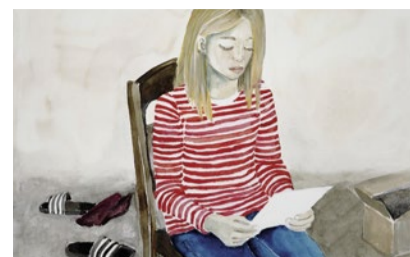
Halt in schweren Zeiten.