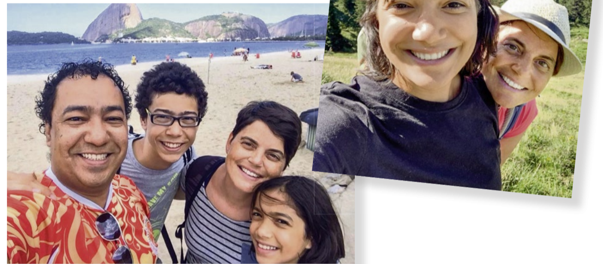
Familie ist möglich, auch auf unkonventionelle Art.