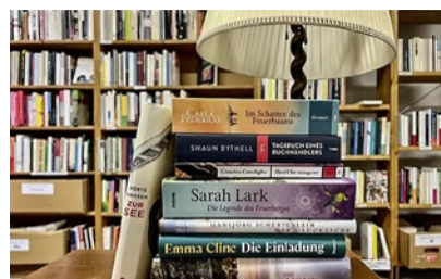
Paradies für Leseratten.