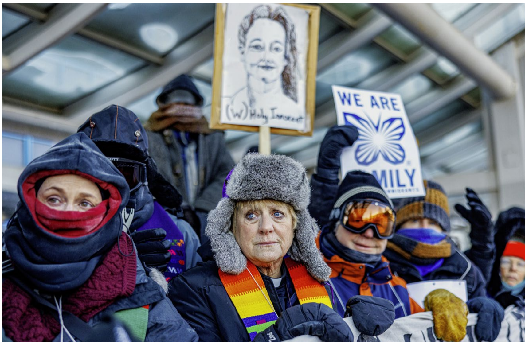
Bei eisigen Temperaturen im Einsatz für Mitmenschlichkeit: Pfarrpersonen am Flughafen von Minneapolis-Saint Paul.

Migration Zwei Monate wehrten sich die Bürger von Minneapolis und Saint Paul gegen die Abschiebepolizei ICE. Pfarrpersonen berichten, wie sich Kirchen und Nachbarschaftsnetzwerke engagieren.