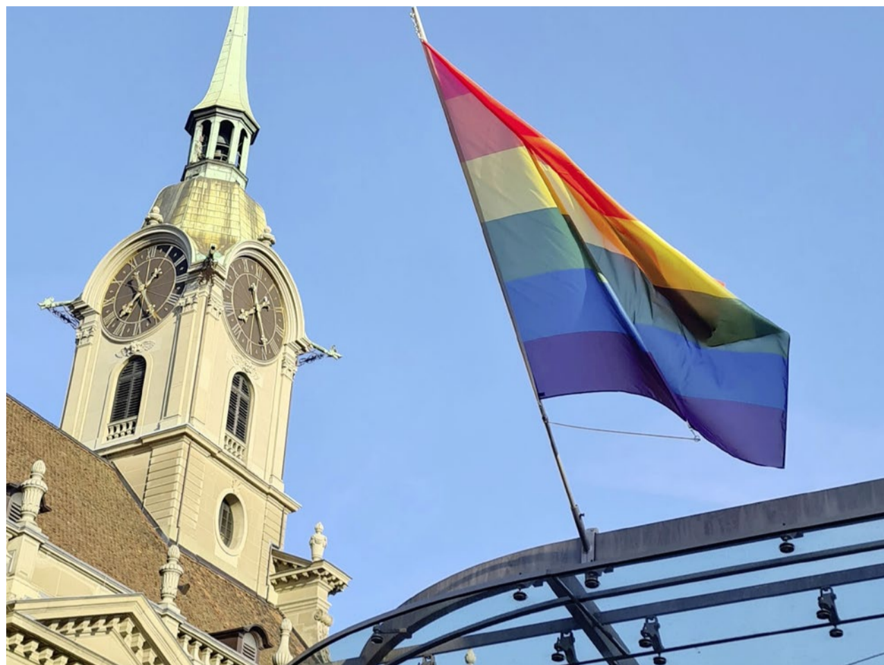
Die Berner Kirchenlandschaft wird bunter und hat ein queeres Pfarramt bekommen.

Statistik Im Jahr 2024 lag der Anteil an Menschen ohne Zugehörigkeit zu einer Religion schweizweit bei knapp 37 Prozent (Tendenz steigend). Die Reformierten brachten es noch auf knapp 19 (Tendenz sinkend), die Katholiken auf 30 Prozent (sinkend). Ein Blick auf eine Infografik des Bundesamts für Statistik zeigt: Vorab im kantonalen Gürtel zwischen Genf und Zürich dominiert die Konfessionslosigkeit. Die Grafik zeigt auch, dass nur in einem Kanton die Reformierten vorherrschen: im Kanton Bern. heb