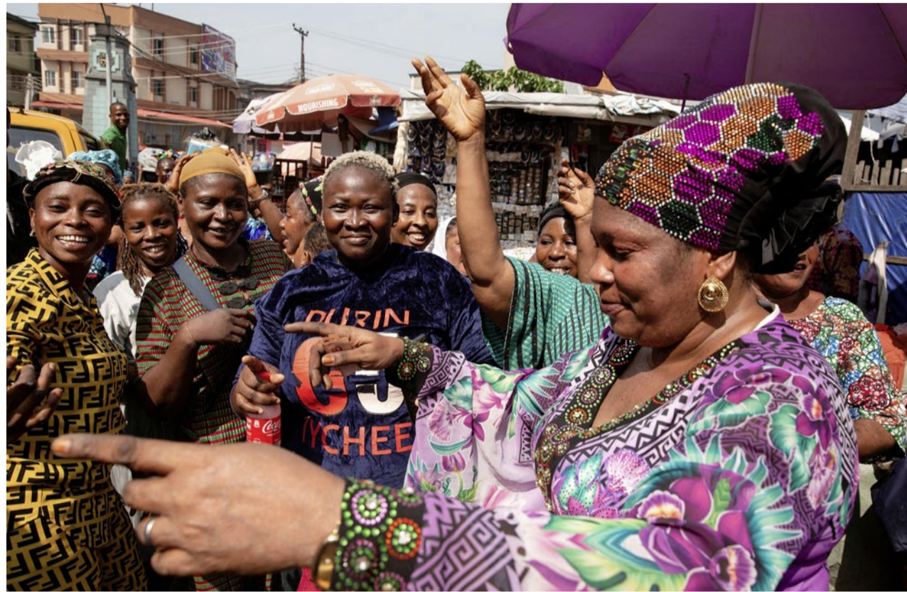
Frauen in Nigeria tragen Hoffnung für Frieden und Sicherheit auf die Strasse.

Im Zoom-Interview, während dessen in ihrem Haus in Lagos mehrmals der Strom ausfällt, erzählt die Methodistin, dass viele Menschen im Land sehr erschöpft seien. «Das Motto steht für unsere grosse Hoffnung auf eine Besserung.» Die Mutter von acht Kindern ist überzeugt: «Wenn wir unsere Last zu Gott bringen, gibt er uns Frieden.» Der Glaube ist für sie aber keine Flucht aus der Realität, sondern eine wichti-