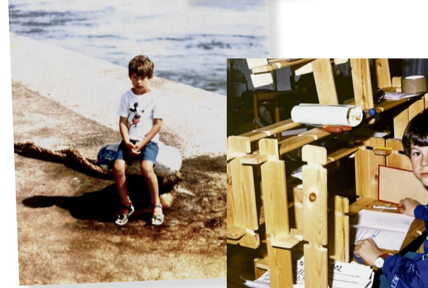
«Wer ist mein Vater?», wird sich der Bub einmal fragen.