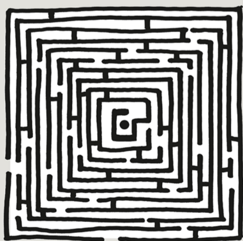
der Weg zum Frieden