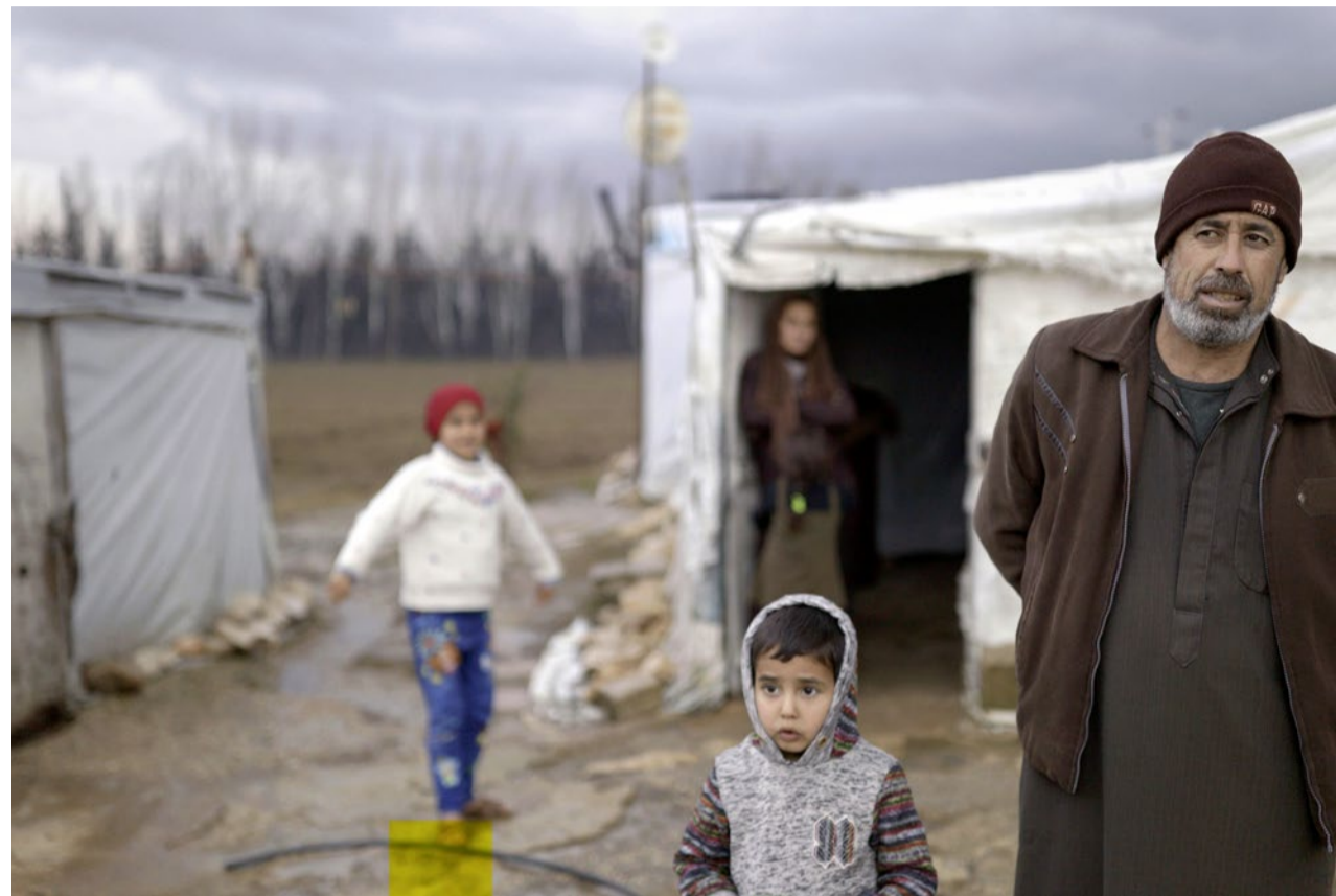
Seit zwölf Jahren ohne Perspektive: Geflüchtete Familie im Libanon.

Film Der Schweizer Regisseur David Bernet stellt in seinem Dokumentarfilm «Solidarity» die Solidarität ins Zentrum. Seine Erkenntnisse fordern das Publikum heraus, sich auch mit Schattenseiten des Prinzips zu beschäftigen.