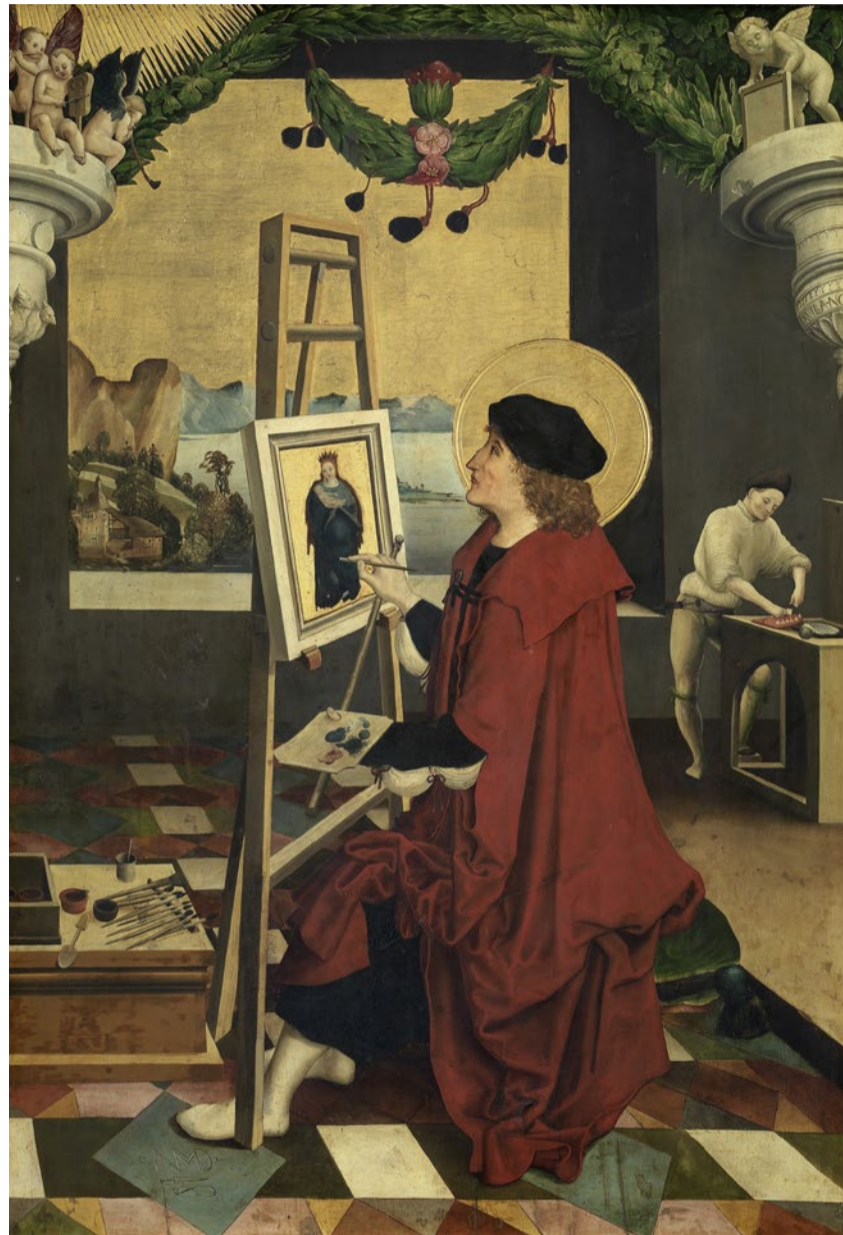
Niklaus Manuels «Der heilige Lukas malt die Madonna».