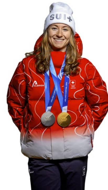
Die 30-jährige Neuenburgerin gewann Gold und Silber an den Olympischen Spielen in Italien.

Restaurant La vie, Bremgartenfriedhof, Weyermannstr. 1, Bern. Öffnungszeiten: Mo bis Fr, 9–19 Uhr. www.restaurantlavie.ch