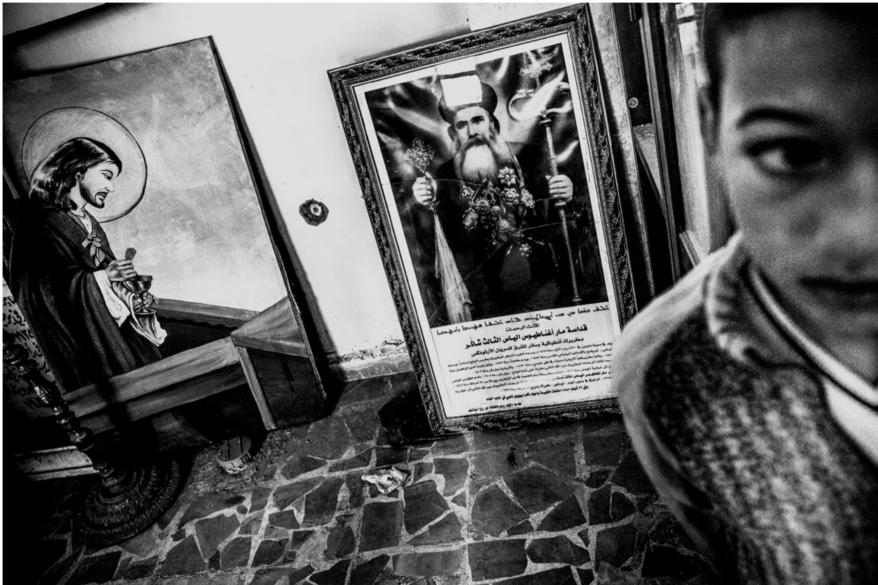
Die Kurden befreiten Syrien vom Islamischen Staat: Kampfspuren in einer orthodoxen Kirche in Ras al Ayn im Oktober 2013.