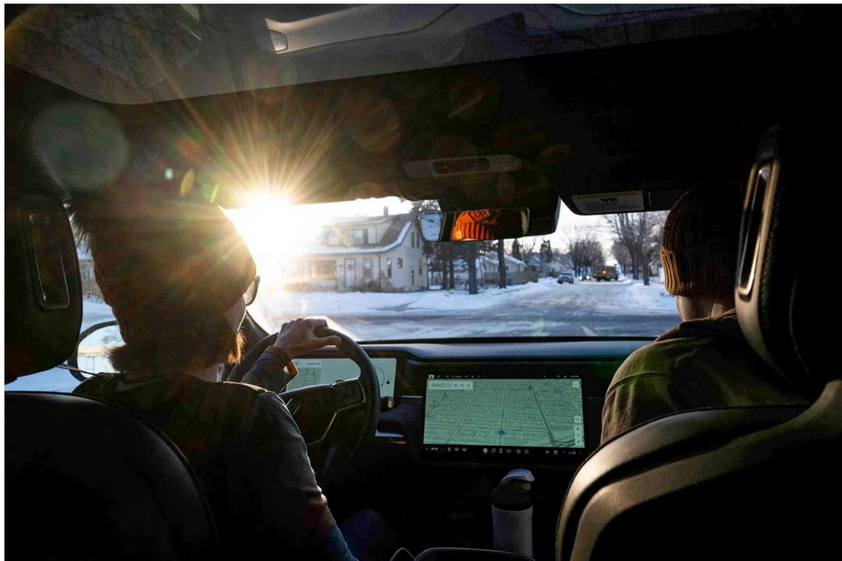
Der umstrittenen Einwanderungspolizei ICE auf der Spur: Bürgerpatrouille in Minneapolis.