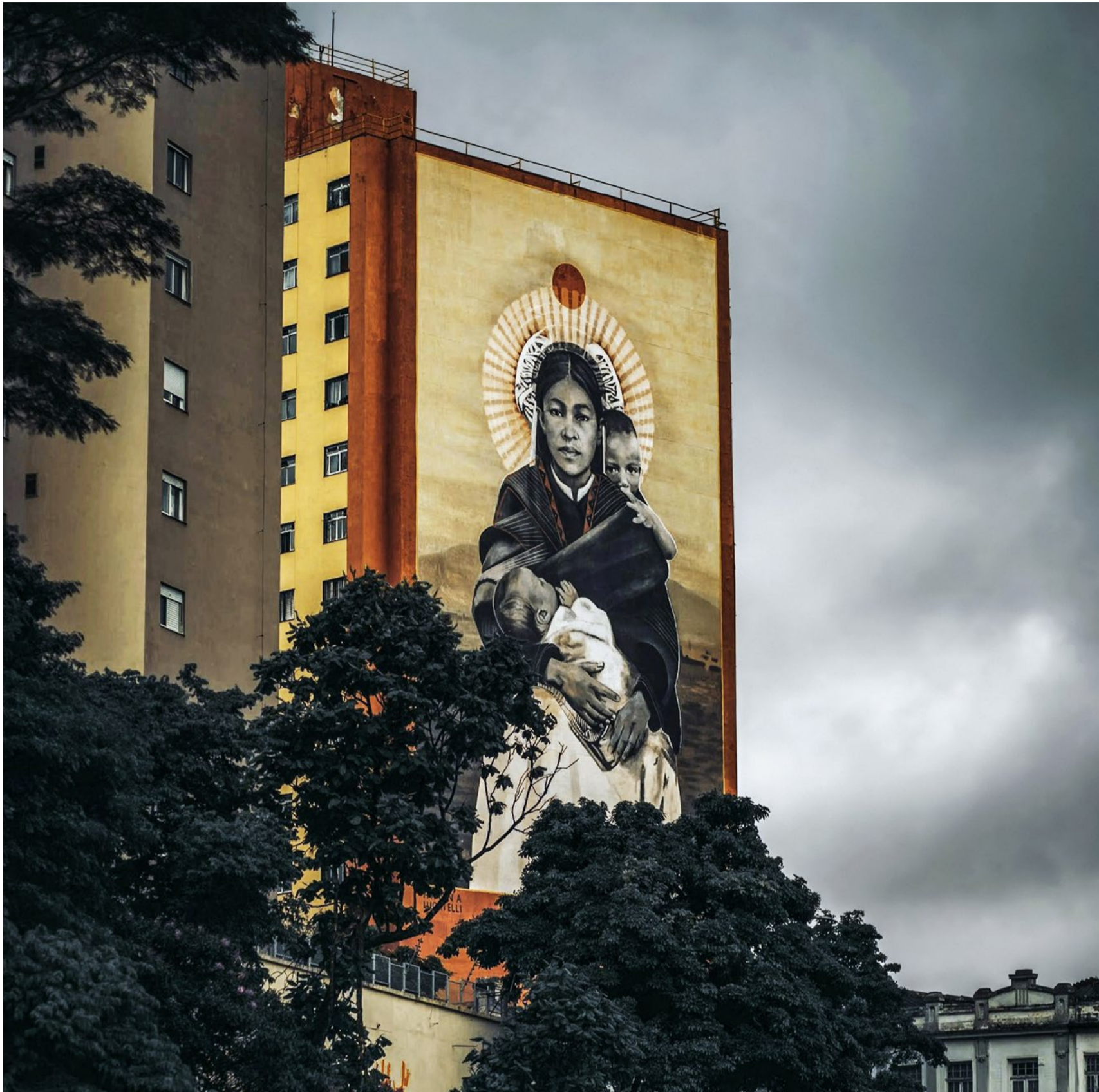
Die Perspektiven von Frauen in der Bibel, in Kirche und Gesellschaft erhalten durch die feministische Theologie mehr Raum.