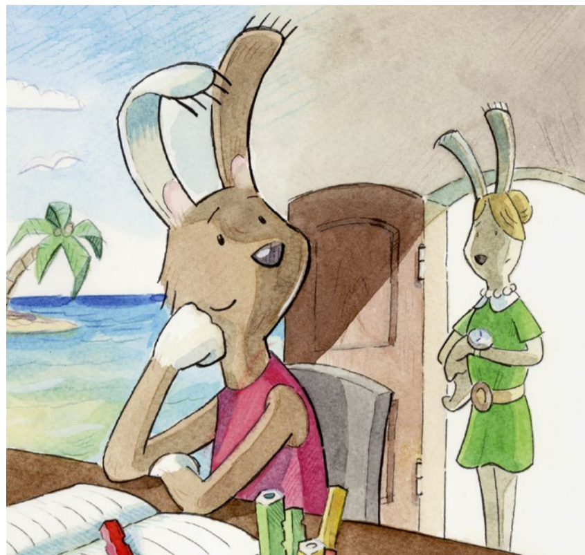
Das zehnjährige Hasenmädchen Lotte driftet oft in seine Traumwelt ab.

Stefanie Rietzler, Fabian Grolimund: Lotte, träumst du schon wieder? Hogrefe, 2020, www.mit-kindern-lernen.ch