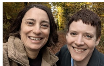
Julia und Simone