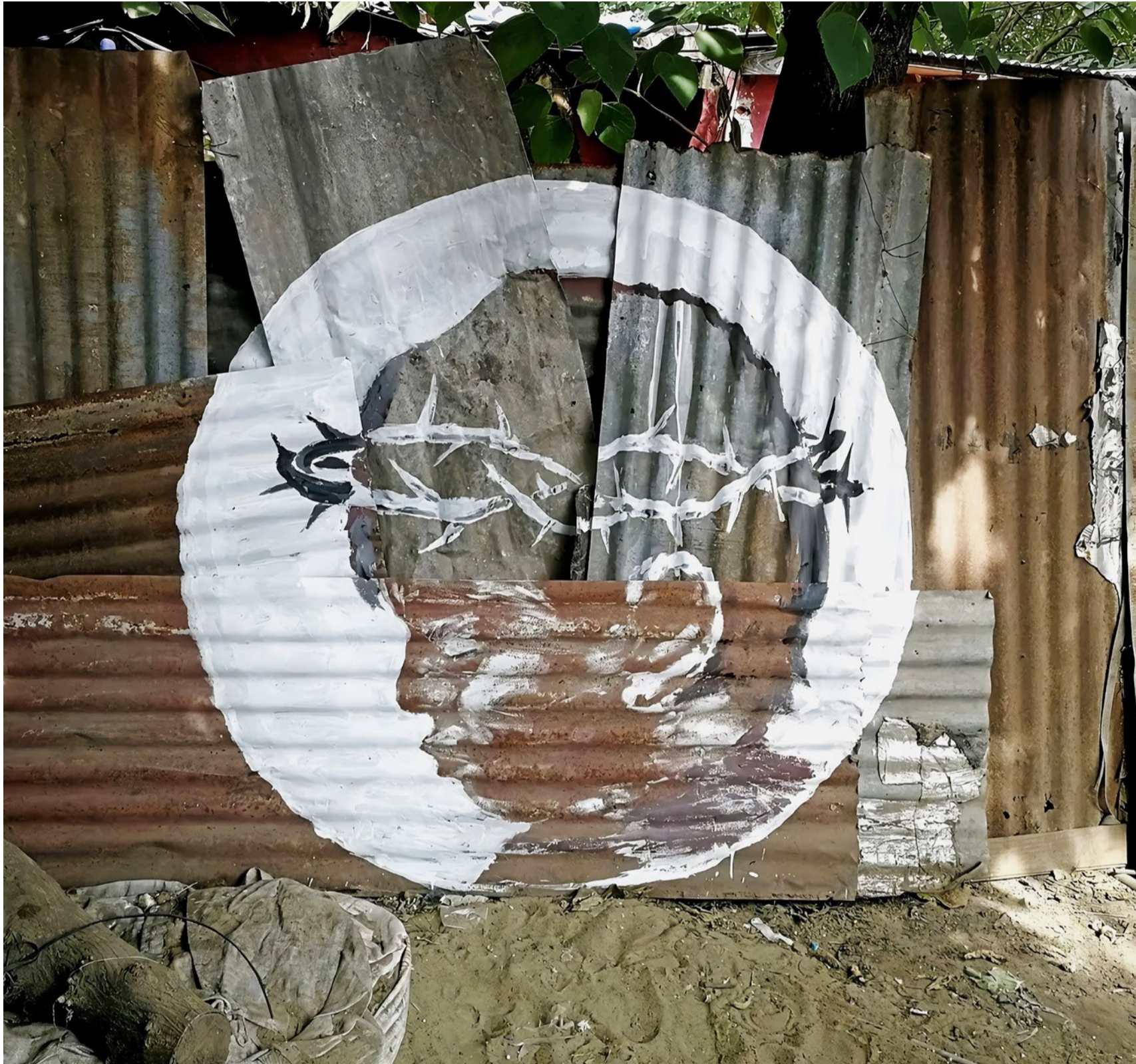
Das Gesicht der Befreiungstheologie hat sich gewandelt, doch Leid und Ungerechtigkeit bleiben eine Realität.