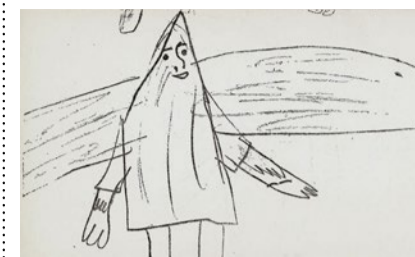
Zeichnen als Kindersprache.