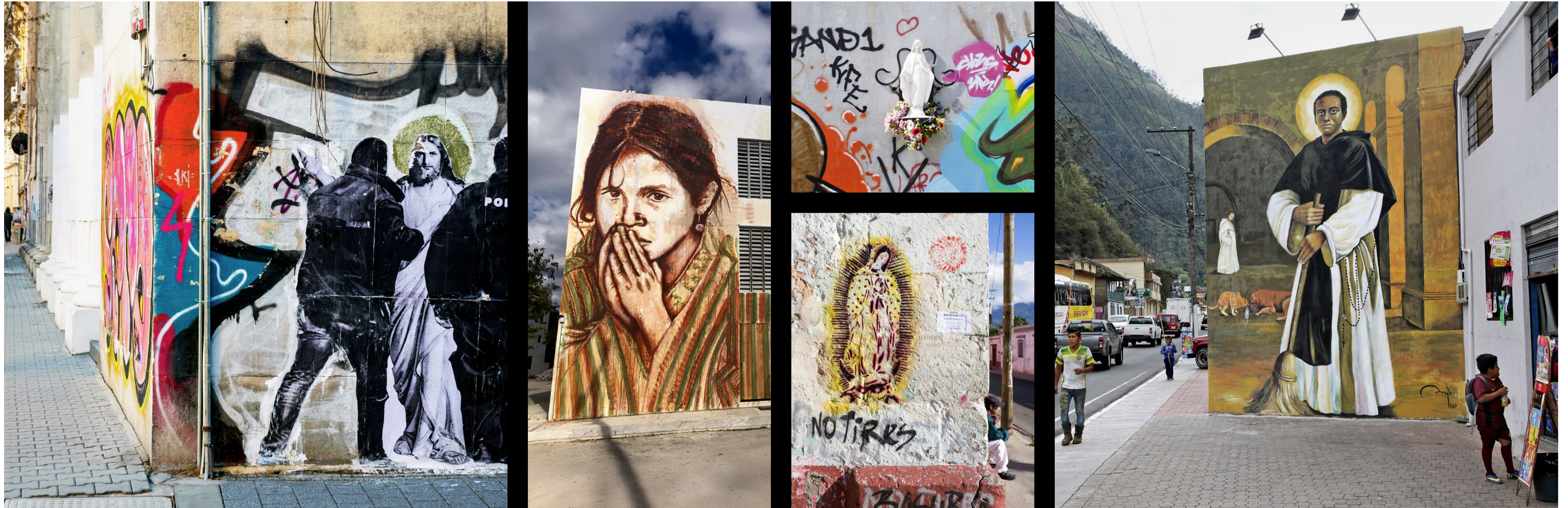
Graffiti und Murals wirken zuweilen wie befreiungstheologische Bildergeschichten: Sie übertragen die Verhaftung Jesu ins Heute, rücken marginalisierte Bevölkerungsgruppen in den Mittelpunkt und interpretieren die Ikonografie von Heiligen neu.