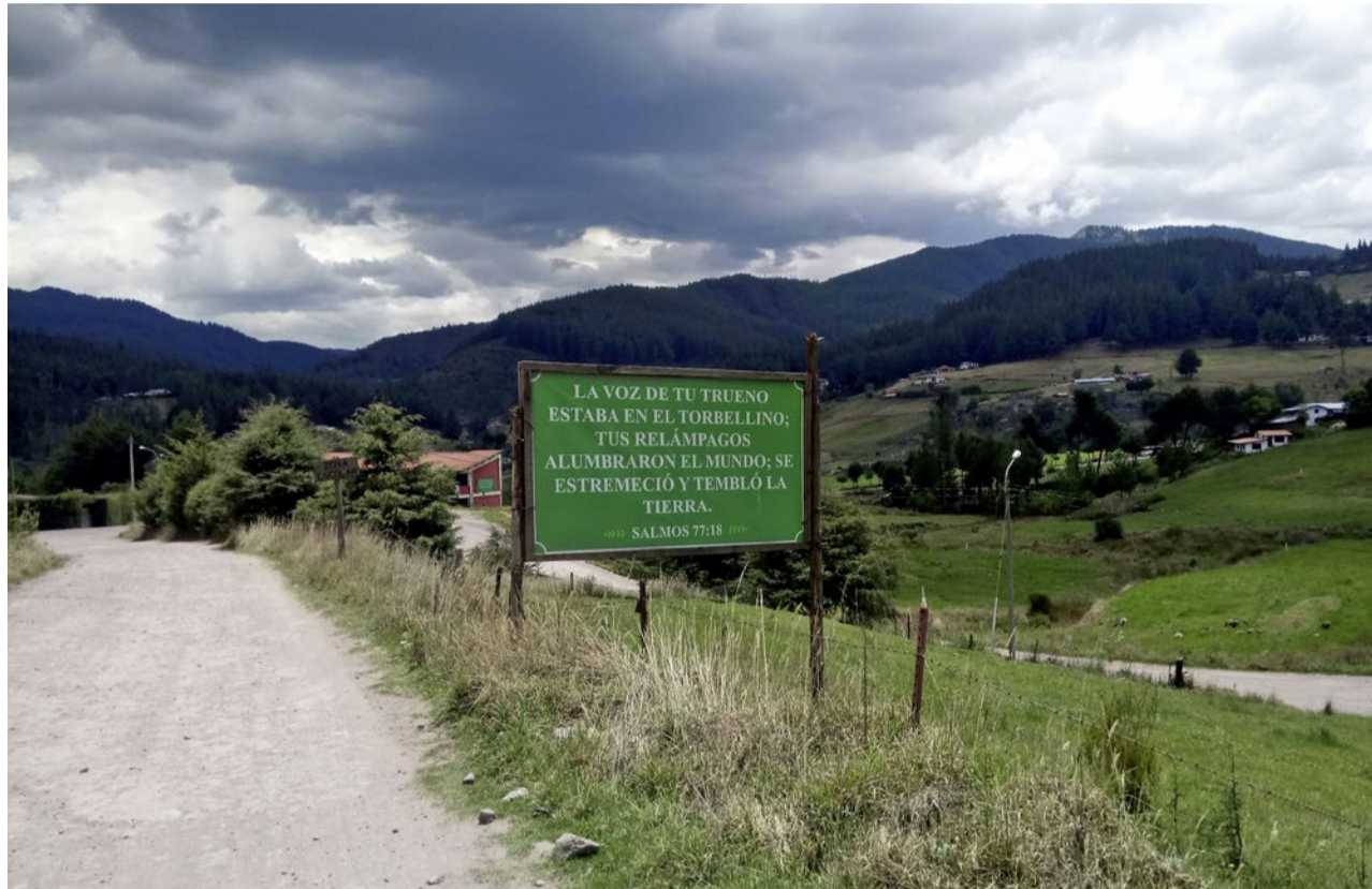
Bibelsprüche statt Marienstatuen: Eine evangelische Siedlung im überwiegend katholischen Peru.

Landbau Neben der grössten Goldmine Südamerikas liegt ein Dorf, das seinen Reichtum im Wald sieht. Die Siedlung Granja Porcón schreibt eine ungewöhnliche Erfolgsgeschichte – inspiriert von einem Bibelvers.