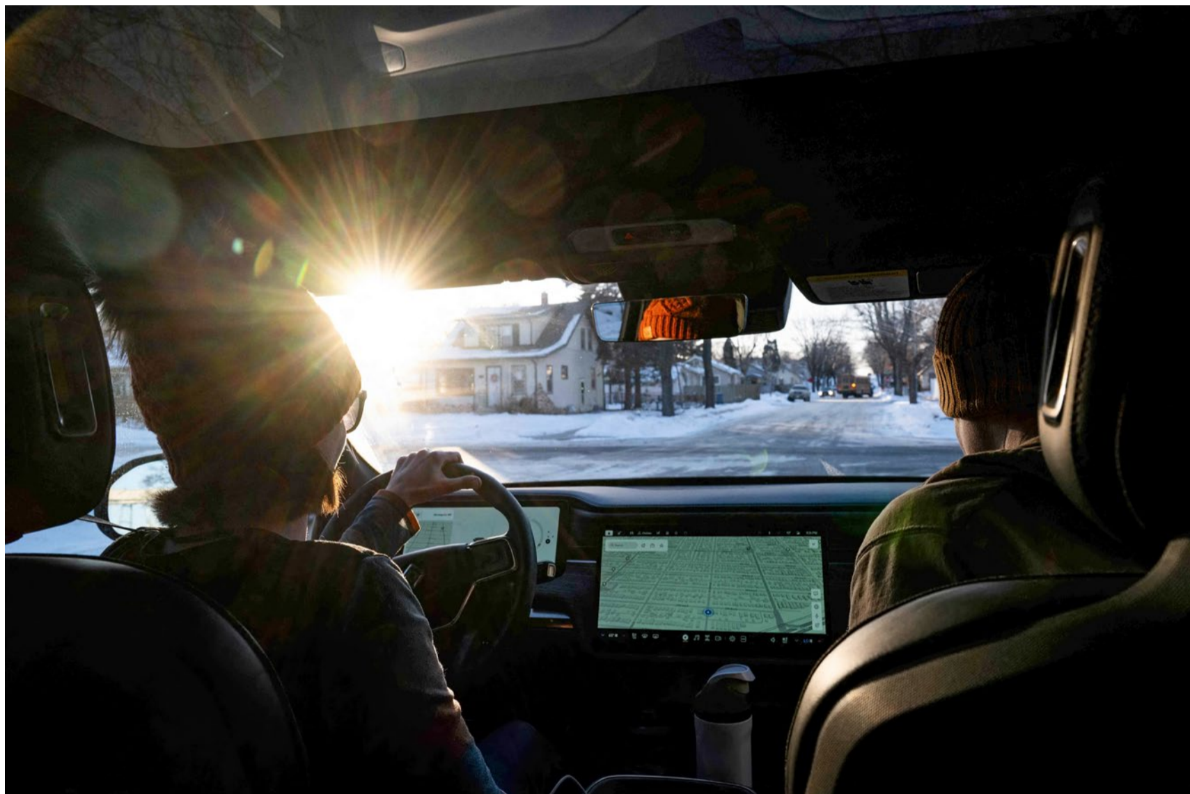
Der umstrittenen Einwanderungspolizei ICE auf der Spur: Bürgerpatrouille in Minneapolis.