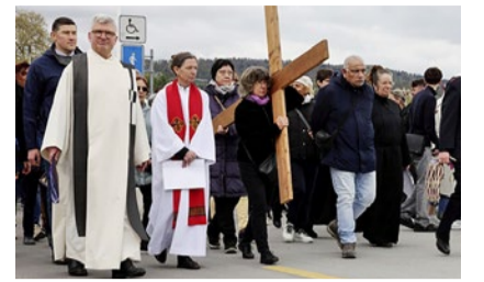
Auf dem Kreuzweg.