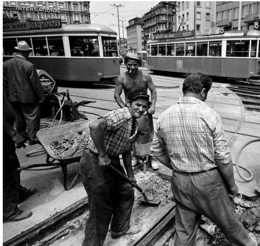
Bauarbeiter am Zürcher Bellevue um 1962.

«Wir, Saisoniers...»: Zürich 1931–2026. Bis 21. Juni, Photobastei, Zürich