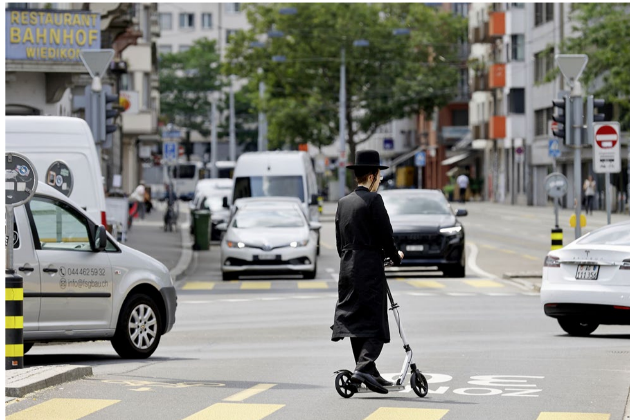
Unterwegs im Schweizer Alltag: Laut Bericht fühlen sich viele Jüdinnen und Juden weniger sicher.