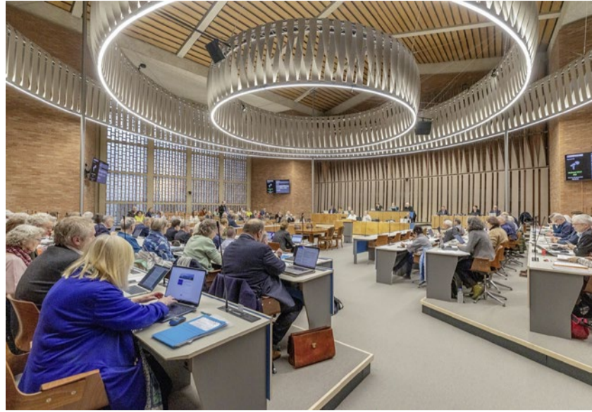
Aufruf zur Wachsamkeit: Zürcher Kirchensynode.

In seiner Antwort knüpft der Kirchenrat an die Stellungnahme an und bekräftigt sie, indem er «allen Formen von Antisemitismus entschieden entgegentritt». Er verurteilt physische Gewalt und verbale Herabsetzung ebenso wie «subtilere Formen der Ausgrenzung und Diskriminierung, die Jüdinnen und Juden als homogene Gruppe beschreiben und sie pauschal mit negativen