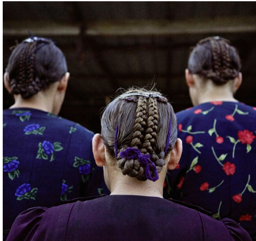
Mennonitische Frauen mit der traditionellen Sonntagsfrisur.

Vernissage und Podium mit Lukas Amstutz, Viola Cadruvi, Nurit Blatman. Moderation: Felix Reich. 16. April, 18 Uhr, Wasserkirche.