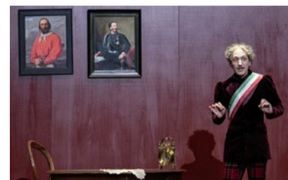
«Il Gattopardo».