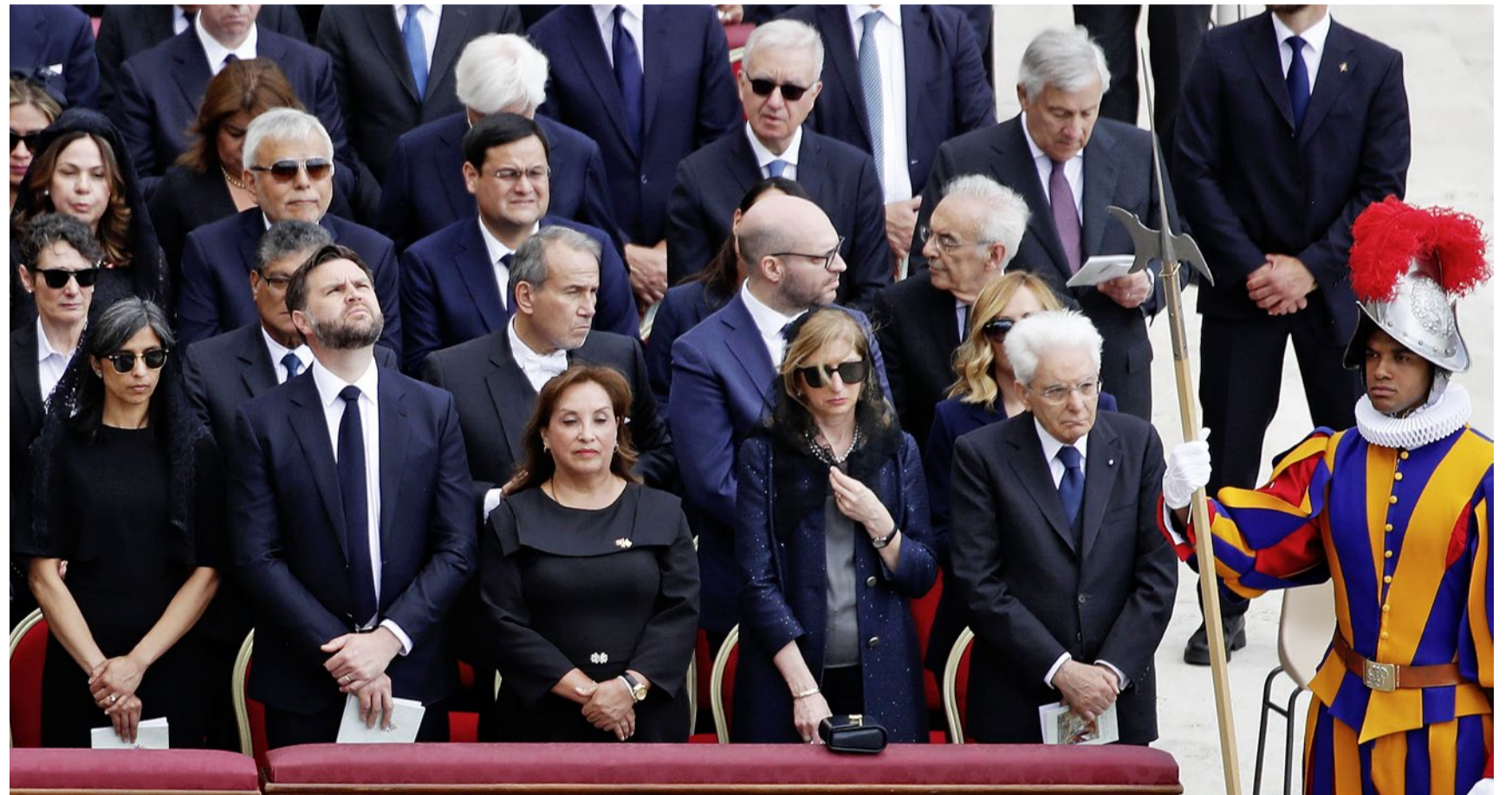
«Esther und Daniel zu religiösen Helden stilisiert»: Der amerikanische Vizepräsident und katholische Integralist James David Vance.