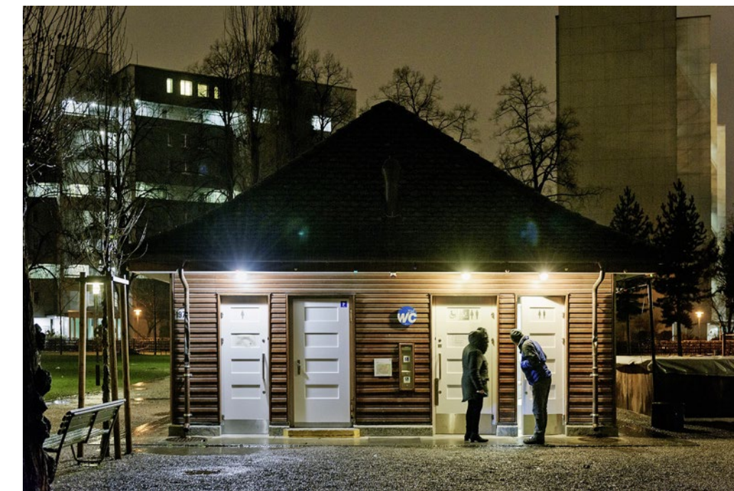
WC-Anlagen: In kalten Nächten bei Obdachlosen wegen des Händetrockners beliebt.

Pfuusbus und Kältepatrouille sind Projekte des Sozialwerks Pfarrer Sieber (SWS). Im Winter 2017/18 zählte das SWS 5517 Übernachtungen im Pfuusbus – ein Drittel mehr als in der vorigen Wintersaison. Der Bus ist mit 15 Betten ausgestattet. Im Vorzelt gibt es 25 Schlafplätze. Für Jugendliche gibt es das Projekt Nemo mit separater Unterbringung.