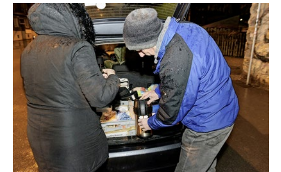
Immer dabei: warmer Tee oder Kaffee.