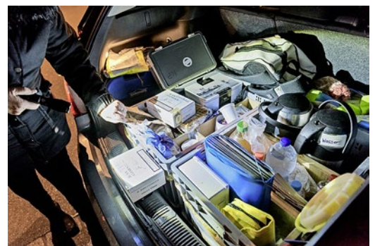
Hilfe-Set: Medikamente und Lebensmittel.