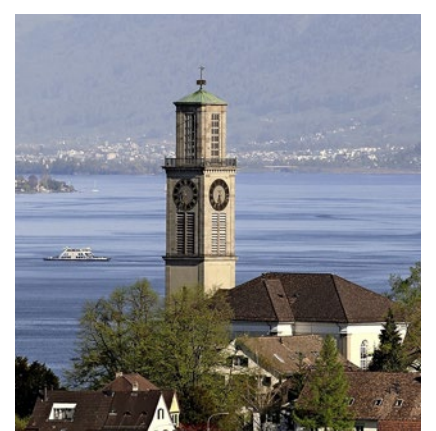
Thalwil: Sind nächtliche Glocken Klang oder Lärm?