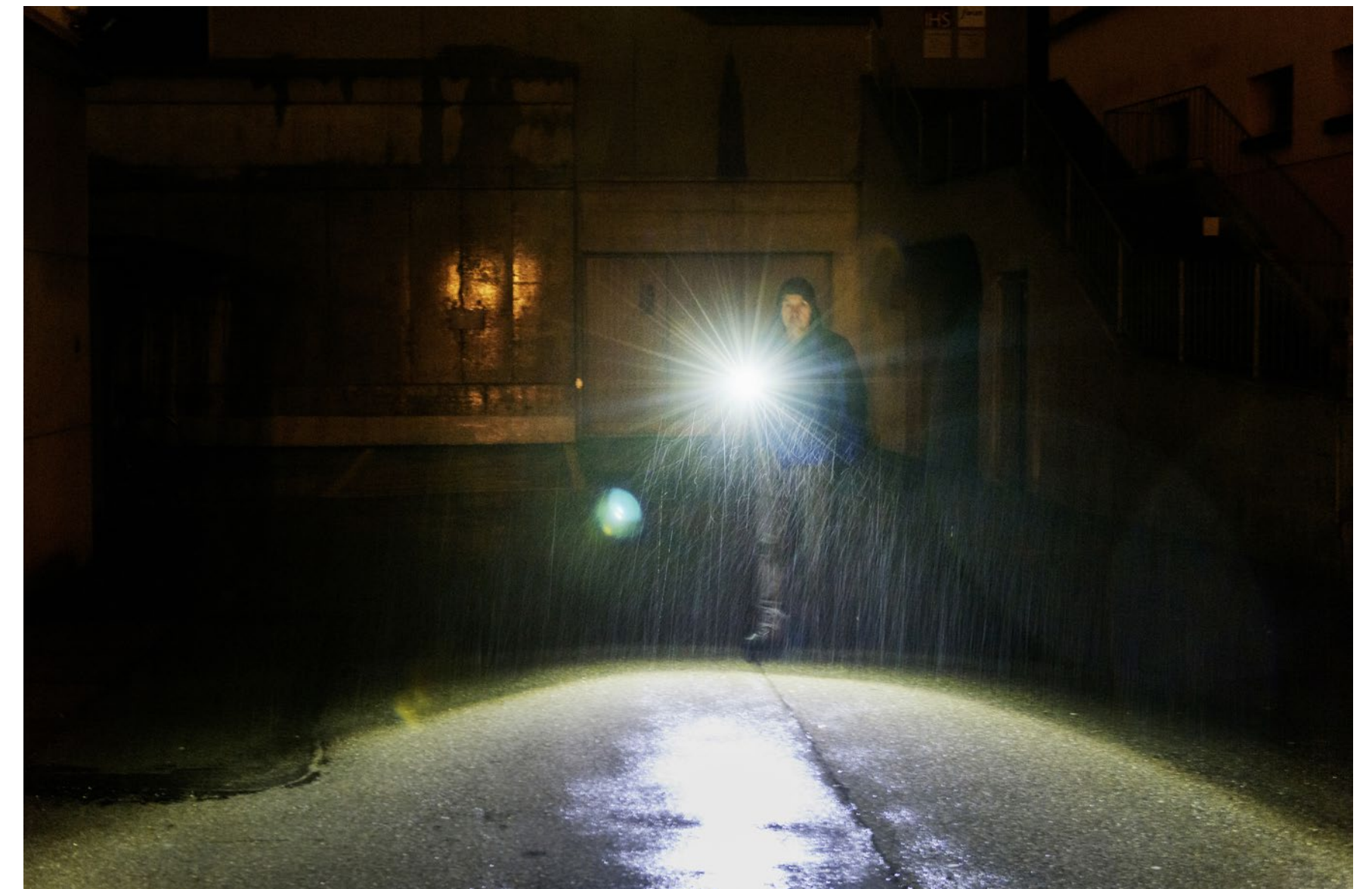
Auf der Suche nach Obdachlosen im Freien: Helfen, wenn bei einem Schlafenden Unterkühlung droht.