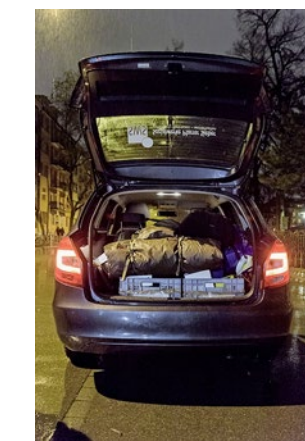
Das vollgeladene Auto.