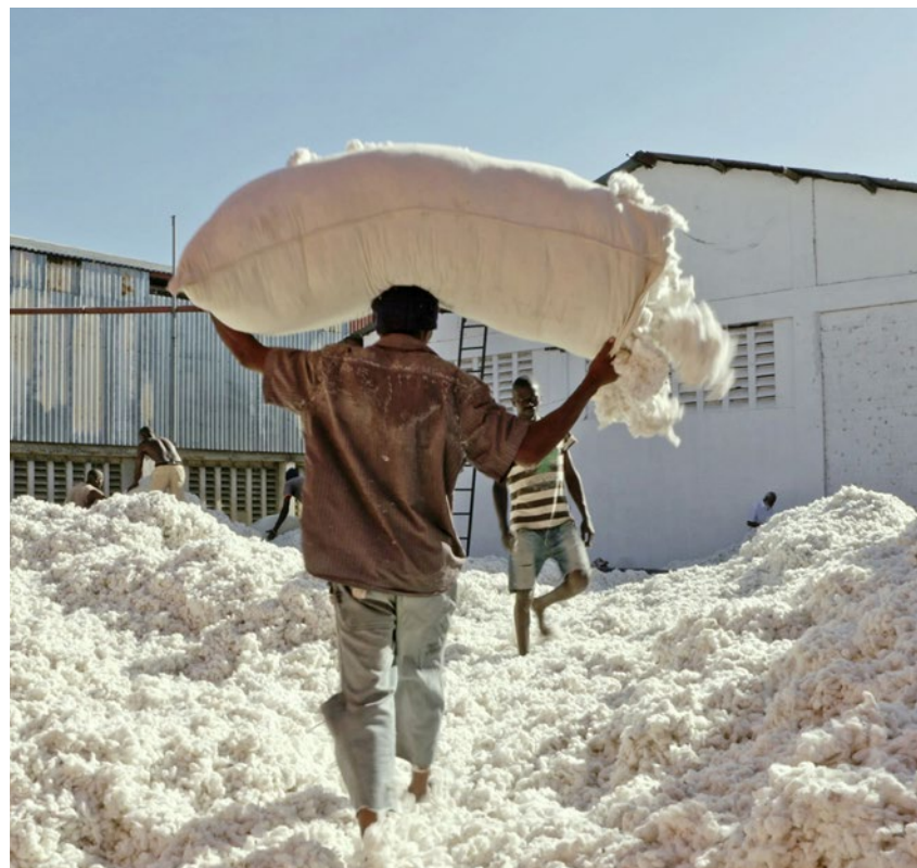
Tansania: Ein Bauer trägt Biobaumwolle ohne Pestizide zur Lagerhalle.

Fair Trader. Regie: Nino Jacusso. Schweizer Kinostart am Donnerstag, 14. Februar.