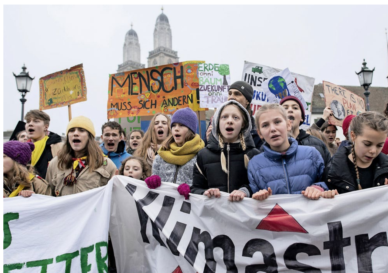
Laut und zahlreich: Am 2. Februar wurde in Zürich und anderen Städten für den Klimaschutz demonstriert.

Die Koordinatoren der Klimastreiks überlegen zurzeit, mit welchen Organisationen und Politikern