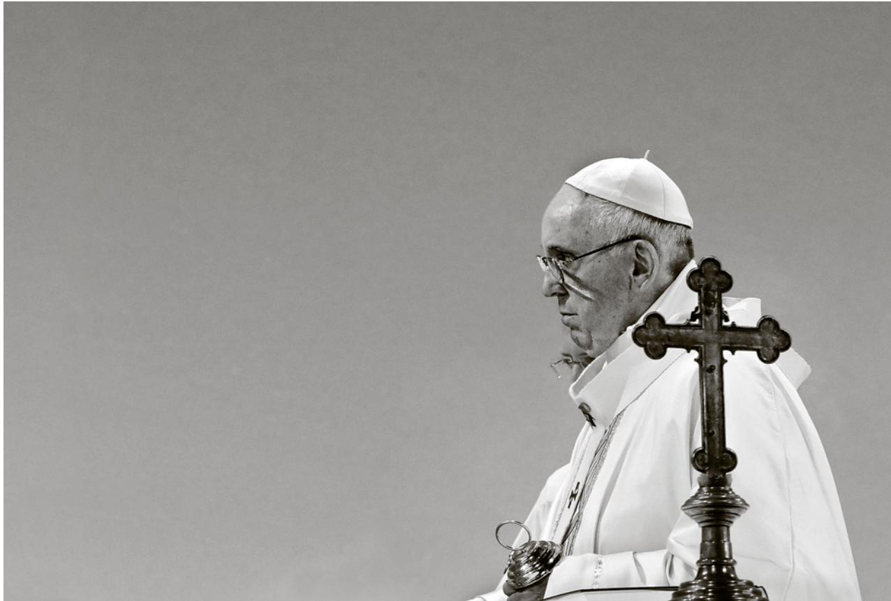
Papst Franziskus selbst soll angesichts des Treffens aufgeregt sein.