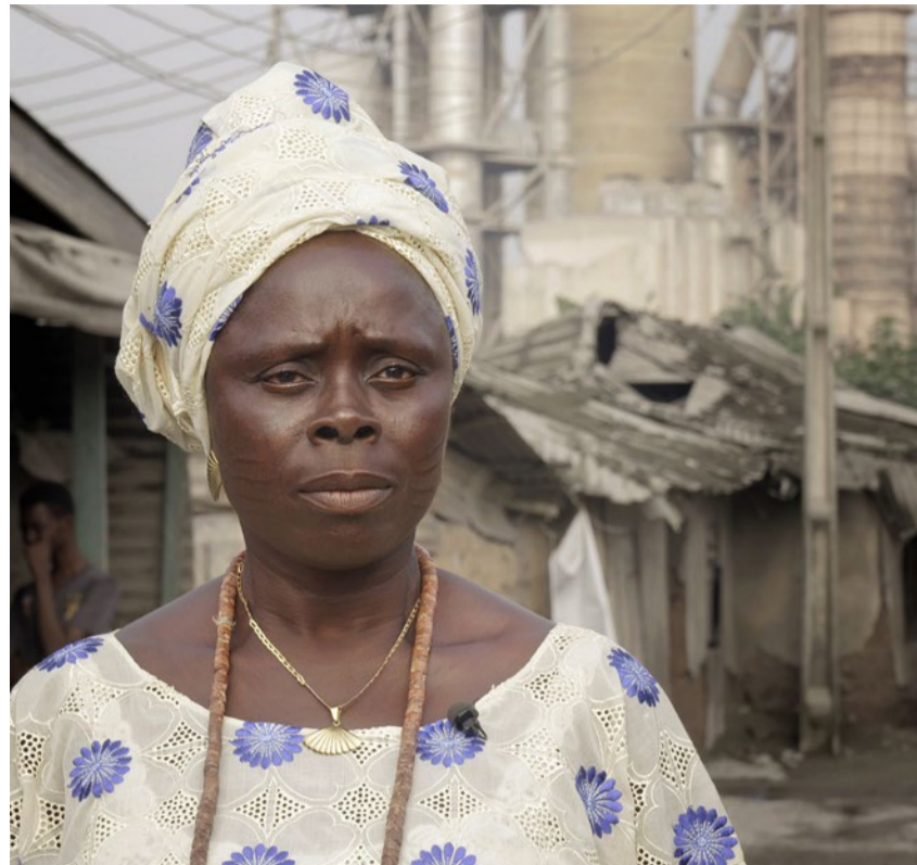
Eine kongolesische Bauernfrau aus «Der Konzern-Report».

«Der Konzern-Report». DVD-Bestellung: www.konzerninitiative.ch/konzern-report-dvd