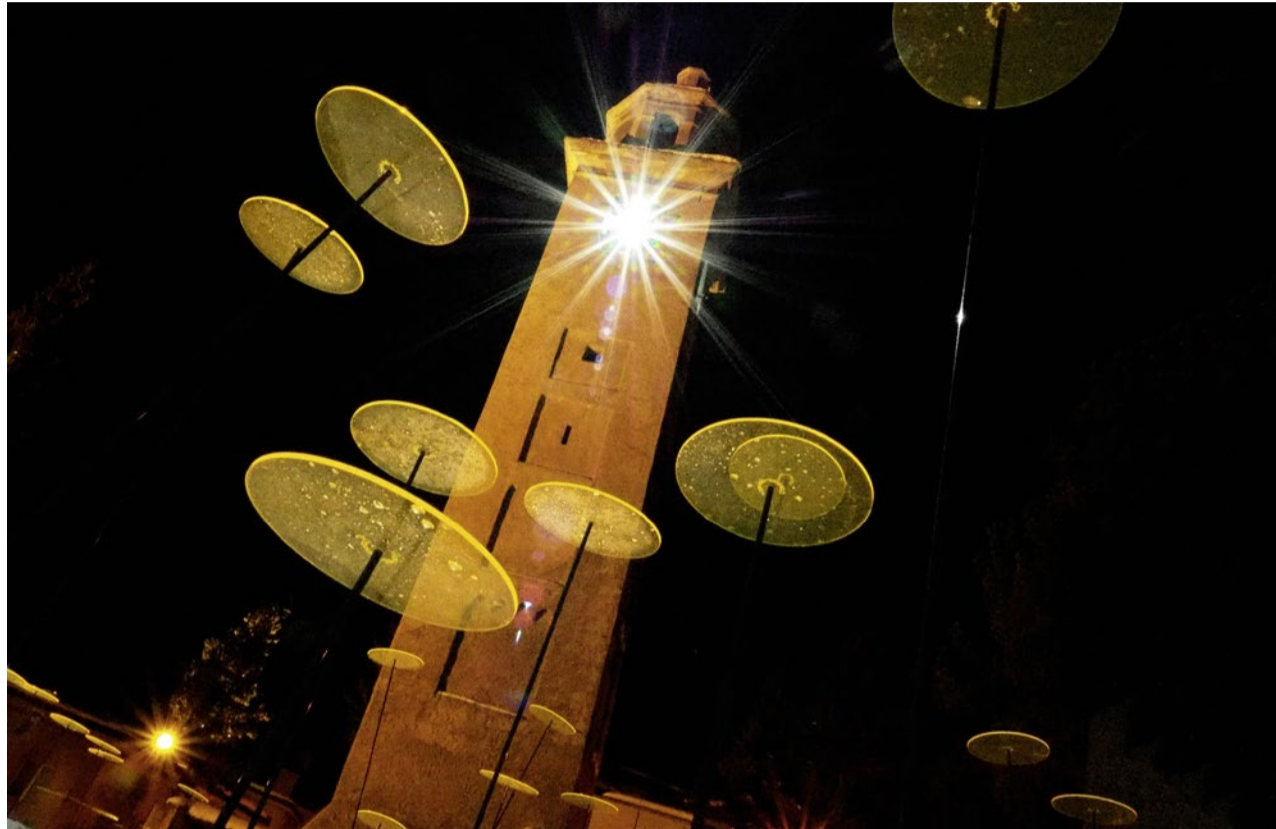
Anderer Blickwinkel: Die Kirche überraschte an der Ski-WM in St. Moritz 2017 mit einer Lichtinstallation.

Gemeinden Zum ersten Mal findet in Graubünden die Lange Nacht der Kirchen statt. Vom Puschlav bis ins Oberland präsentiert sich Kirche unkonventionell. Ein spannender Einblick vor allem auch für Kirchenferne.