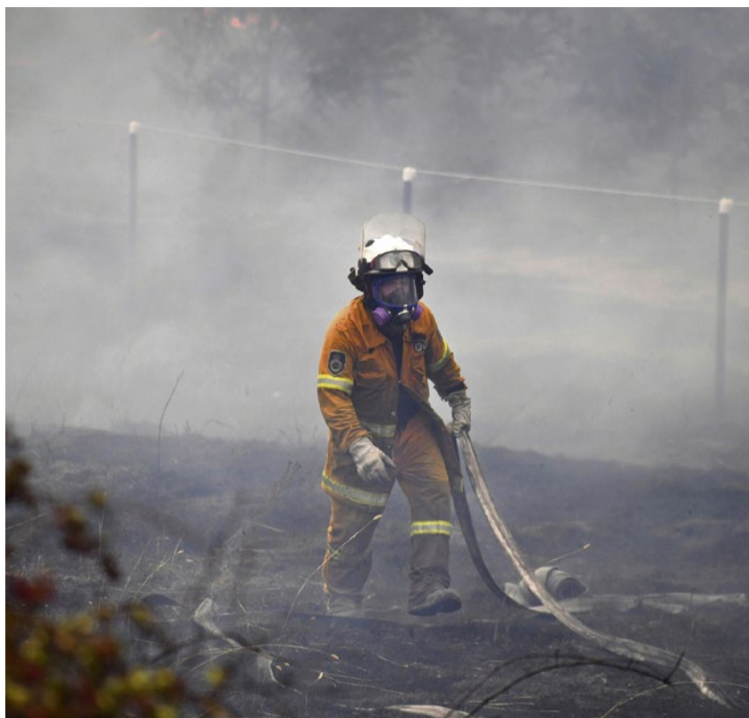
Kampf gegen die Buschbrände im Bundesstaat New South Wales.