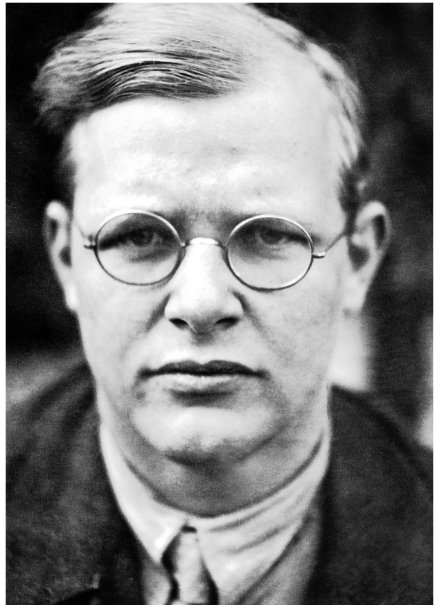
Gelebte Theologie: Dietrich Bonhoeffer.