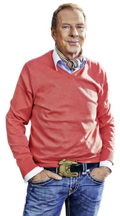
Kurt Aeschbacher moderierte 18 Jahre lang die Talksendung «Aeschbacher» bis Ende 2018.