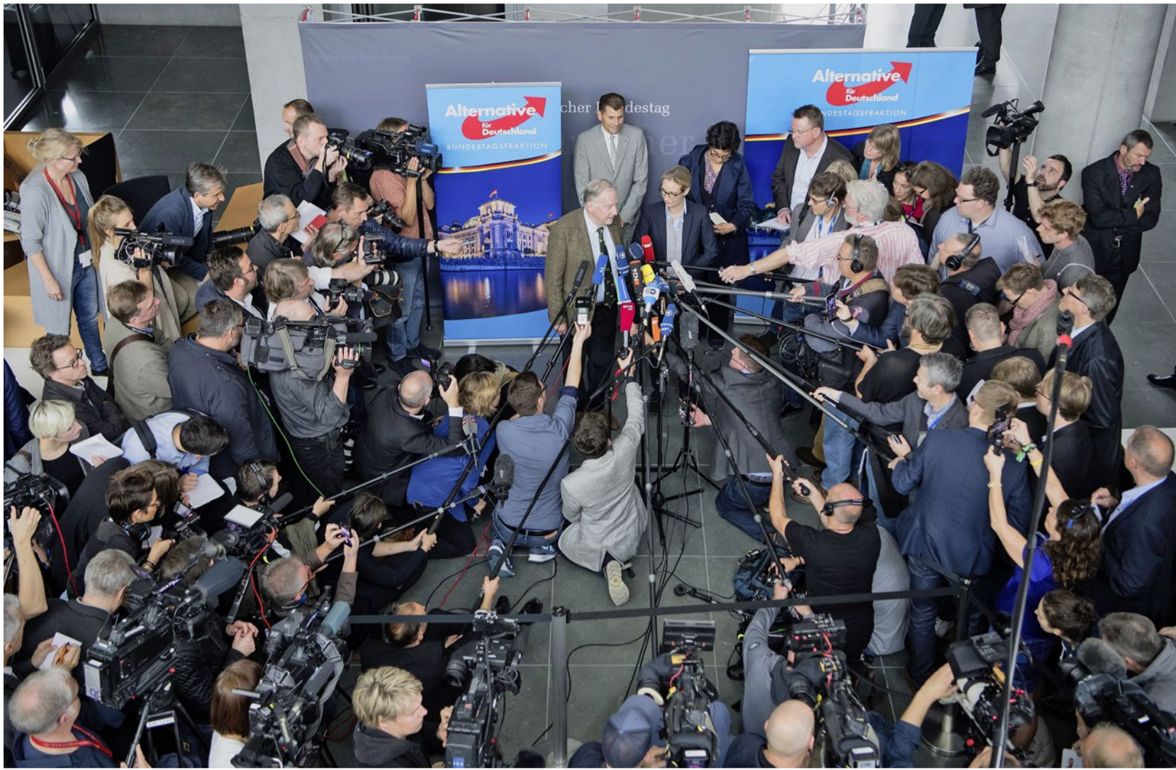
Nach ihrem Einzug in den Bundestag ist die AfD in den Fokus des öffentlichen Interesses gerückt