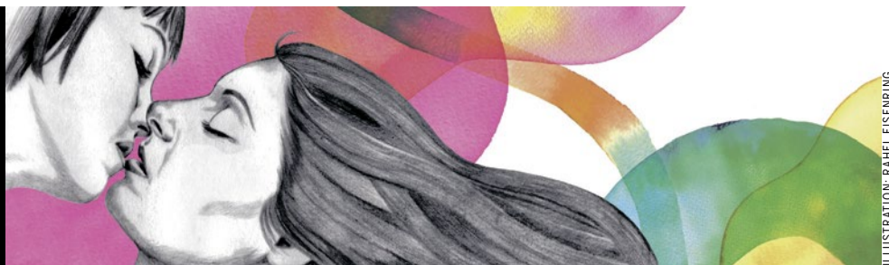
ILLUSTRATION: RAHEL EISENING