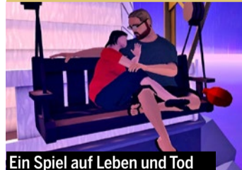
Ein Spiel auf Leben und Tod