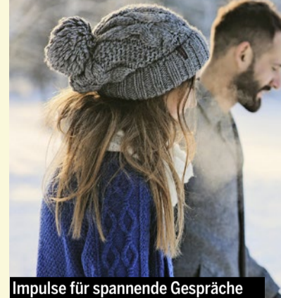
Impulse für spannende Gespräche