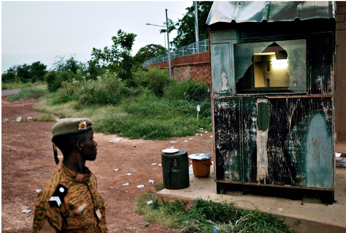
Die Putschisten wurden wieder vertrieben: Kampfspuren an einem Militärstützpunkt in Ouagadougou

ENTWICKLUNGSHILFE/ Burkina Faso galt als stabiler Staat in Westafrika. Doch vor den freien Wahlen gerät das Land ins Taumeln. Hilfswerken, die sich dort engagieren, macht der Aufbruch aber mehr Hoffnung als Angst.