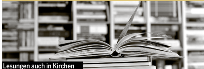
Lesungen auch in Kirchen