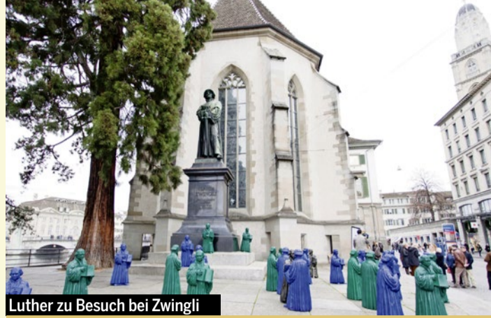
Luther zu Besuch bei Zwingli