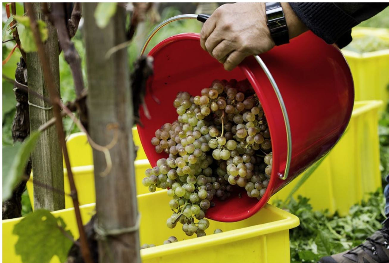
Rebsele mitten in Stadtzürcher Gebiet: Gesunde Trauben steigern die Vorfreude der Erntehelfer auf den diesjährigen Jahrgang