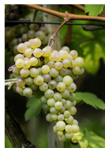
Biblisches vieldeutig: Trauben

Da ist zum Beispiel die Stelle, in der die Reben erstmals in der Bibel auftreten. Nach der Sintflut verlässt Noah die Arche und legt einen Weinberg an. Interessant